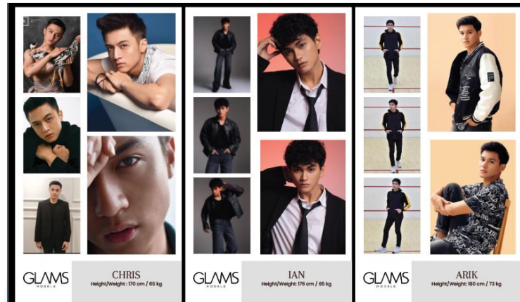
Gambar 2. 5 Compcard dari perusahaan Glams

Karena perusahaan ini memiliki sisi kuat dalam pengadaan talent berupa model, maka perusahaan Glams Agency & Production memiliki list compcard yang menunjukan berbagai talent model yang variatif dan luas dengan spesifikasi yang sangat beragam dari klasifikasi umur, fisik, genetik, ras dan jenis kelamin. Compcard tersebut memiliki peran sebagai portofolio untuk database model yang dimiliki perusahaan Glams dan juga sebagai katalog untuk client yang sedang menjadi talent berupa model untuk kebutuhan komersil. Compcard tersebut diperbarui setiap bulan untuk menampilkan perkembangan dan tampilan terbaru para model dari waktu ke waktu.