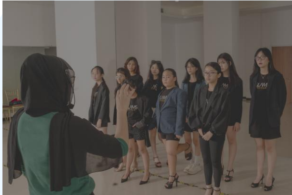
Gambar 2. 2 Suasana kelas personality development di Glams

Berdasarkan wawancara singkat dari salah satu tim management dari Glams, perusahaan ini sudah bergerak di bidang entertainment dari tahun 2009. Yang dimana awalnya, perusahaan ini hanya bergerak di bidang sanggar modelling untuk anak-anak, remaja dan dewasa. Sebelumnya, perusahaan tersebut memiliki nama Glow talents academy yang bergerak sebagai sanggar yang menyediakan sarana edukasi yang berkorelasi dengan entertainment seperti modelling, acting , seni tari, dan edukasi public speaking . Karena perusahaan ini memiliki hubungan yang erat dengan dunia entertainment, maka perusahaan Glams juga menyediakan jasa berupa jasa mengorganisir acara untuk beberapa mal dan beserta menyediakan sumber daya manusia seperti MC , penari dan model untuk kebutuhan komersil dalam suatu acara.