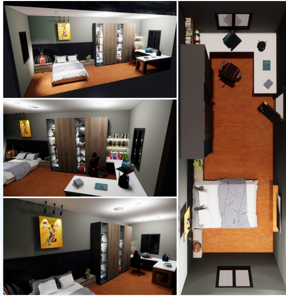
Gambar 2.3 Desain 3D untuk Proyek Renovasi Kamar Anak

Berikut adalah karya berupa desain 3D interior kamar. Desain ini memperlihatkan secara detail tata letak ruangan, pemilihan kombinasi warna, serta pengaturan pencahayaan ruangan. Dengan adanya desain 3D, klien dan desainer dapat lebih mudah menilai kesesuaian konsep dengan kebutuhan dan preferensi pengguna.