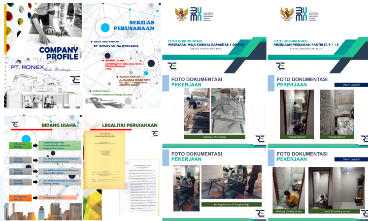
Gambar 2. 5 Company Profile PT. Ronex Muda Berkarya

Berikut adalah company profile PT. Ronex Muda Berkarya. Di dalamnya berisi informasi lengkap mengenai perusahaan, mulai dari profil, keahlian di bidang konstruksi, lingkup usaha, hingga penjelasan mengenai proyek-proyek yang telah diselesaikan. Dengan adanya company profile ini, perusahaan dapat lebih mudah memperkenalkan diri secara profesional sekaligus memperkuat peluang kerja sama dengan klien.