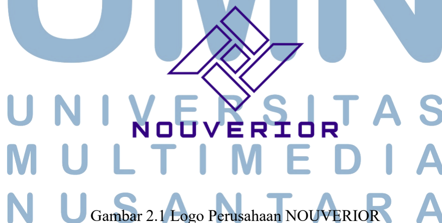
Gambar 2.1 Logo Perusahaan NOUVERIOR

Nama Nouverior berasal dari dua kata, yaitu “Nouve” yang berarti baru dalam bahasa Latin, dan “Rior” yang diambil dari kata superior. Gabungan kedua kata tersebut mencerminkan filosofi perusahaan yang mengedepankan inovasi dan keunggulan dalam setiap karya yang dihasilkan. Saat ini, Nouverior sedang mengembangkan proyek orisinal berupa game berbasis 3D yang menggunakan karakter dan Intellectual Property (IP) buatan mereka sendiri.