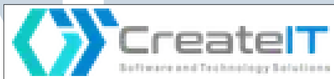
Gambar 2.1. Logo perusahaan PT. CreateIT Solution Indonesia

CreateIT adalah sebuah perusahaan dalam bidang IT yang beroperasi di Indonesia, tepatnya di daerah Alam Sutera, Tangerang. Perusahaan ini telah berdiri sejak tahun 2009. Awalnya, perusahaan ini dikenal dengan nama Indotim, yang berfokus pada pengembangan aplikasi Work Expert sebagai kerja sama dengan perusahaan Prosolution Austria, yaitu sebuah perusahaan yang menyediakan perangkat lunak ERP (Enterprise Resource Planning) yang telah berdiri sejak tahun 2000.