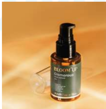
Gambar 2.2.9 Desain Kemasan Bloom Up

Proyek terbaru Lyden Studio adalah perancangan identitas merek dan desain kemasan untuk produk self-care Bloom Up. Dalam proyek ini, Lyden menghadirkan konsep visual yang feminin, modern, dan menenangkan, menggambarkan semangat self-love serta perawatan diri yang menjadi nilai utama brand tersebut. Proyek ini juga menjadi bukti konsistensi Lyden dalam beradaptasi dengan tren dan kebutuhan pasar modern di industri gaya hidup dan kecantikan.