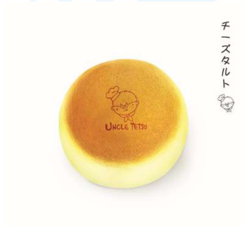
Gambar 2.2.4 Ilustrasi “Signature Cheesecake”

Lyden dipercaya untuk memproduksi ilustrasi produk mendatang milik brand makanan penutup ternama, Uncle Tetsu. Proyek ini berfokus pada pengembangan visual yang menarik dan menggugah selera, sejalan dengan citra brand yang dikenal karena produk kue keju khas Jepang yang lembut dan ikonik.