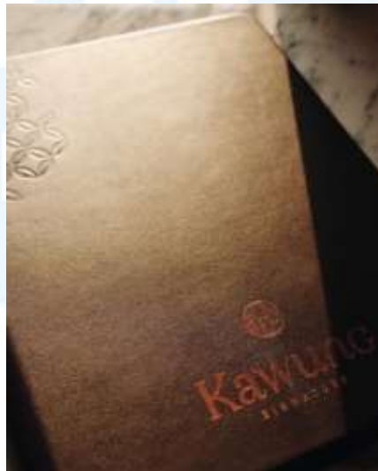
Gambar 2.2.7 Buku Menu Kawung Signature

Lyden Studio dipercaya untuk merancang strategi branding bagi restoran Kawung Signature. Melalui pendekatan kreatif dan riset mendalam, Lyden menciptakan konsep visual yang memperkuat karakter khas kuliner nusantara dengan sentuhan modern, menjadikan restoran ini tampil menonjol di tengah kompetisi industri kuliner yang semakin berkembang.