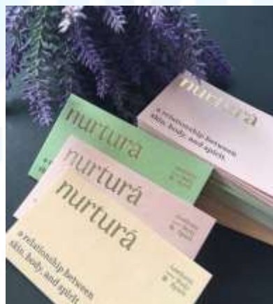
Gambar 2.2.3 Business Card Nurtura

Lyden Studio memperluas cakupan bidang kreatifnya dengan berkolaborasi bersama Nurtura, sebuah pusat layanan kesehatan, dalam proses perancangan logo dan identitas merek. Melalui proyek ini, Lyden berhasil menggabungkan konsep profesionalisme dan kelembutan dalam desain, mencerminkan nilai-nilai empati serta perhatian yang menjadi inti layanan Nurtura.