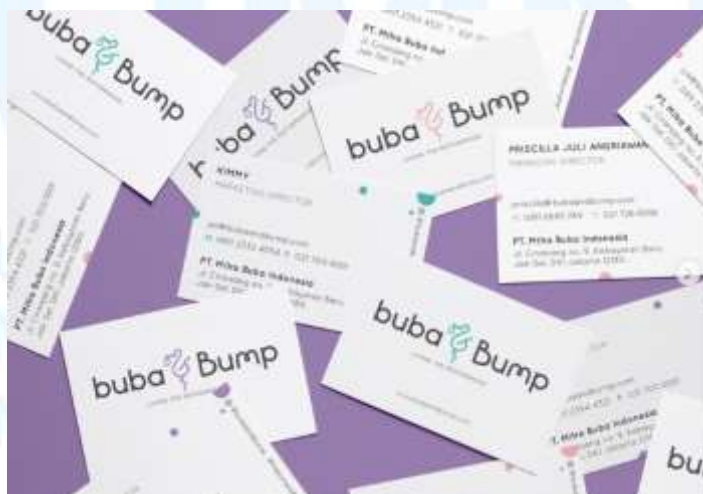
Gambar 2.2.6 Business Card buba&bump

Masih di bulan yang sama, Lyden Studio berkolaborasi dengan Arpose Design Studio dalam perancangan dukungan branding untuk buba&bump, pusat layanan ibu dan bayi. Proyek ini menekankan pada komunikasi visual yang bersahabat, modern, dan menyenangkan, guna menciptakan citra merek yang mampu membangun rasa aman serta kedekatan dengan para ibu muda.