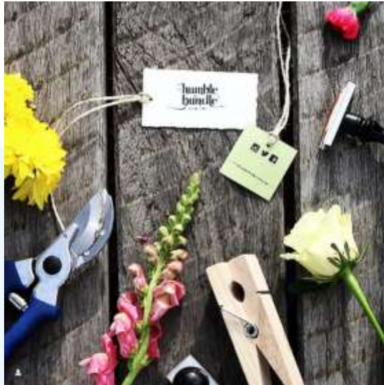
Gambar 2.2.1 Photoshoot dengan Humble Bundle Melbourne

menampilkan kemampuan artistik dan profesionalisme dalam bidang fotografi produk serta penataan visual merek yang berkarakter.