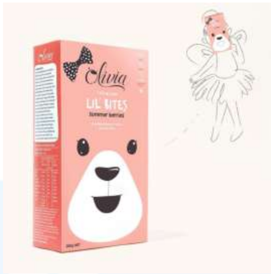
Gambar 2.2.5 Desain Kemasan Olivia Baby Food