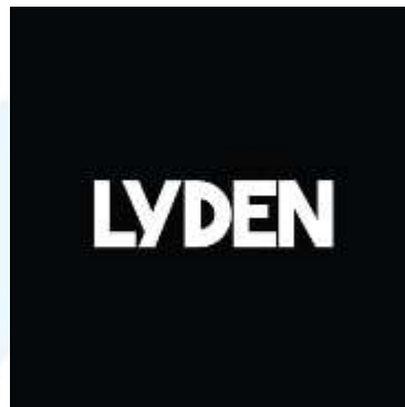
Gambar 2.1 Logo Organisasi Perusahaan Lyden Studio

Lyden Studio (atau Lyden Creative Agency) adalah sebuah agensi kreatif yang didirikan pada tahun 2015 dan telah berkembang menjadi nama yang terpercaya dalam bidang branding dan media sosial.