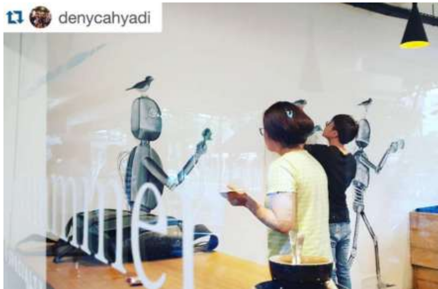
Gambar 2.2.2 Penggambaran mural di Yellowhammer Coffee, Lippo Cikarang