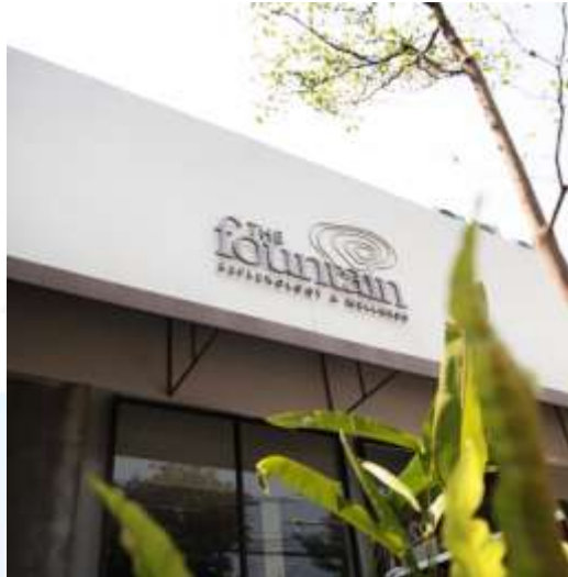
Gambar 2.2.8 Pusat The Fountain Reflexology & Wellness