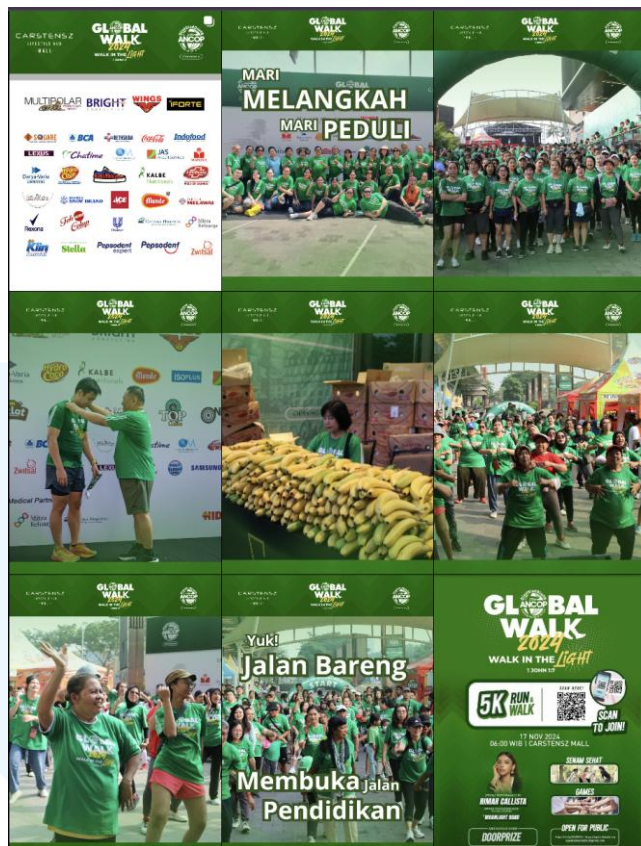
Gambar 2. 4 Media Sosial ANCOP Global Walk 2024

Peran Bright Consulting dalam acara ini adalah sebagai pendukung utama sejak 2011 hingga saat ini. Bright Consulting membantu mendanai dan juga menyumbang tenaga kerja agar acara ini dapat terlaksanakan. Dukungan yang konsisten ini menunjukkan komitmen Bright Consulting terhadap kegiatan sosial dan pemberdayaan masyarakat. Melalui keterlibatannya, Bright Consulting berharap dapat memberikan dampak positif yang berkelanjutan bagi penerima manfaat acara ini (Bright Consulting, 2025).