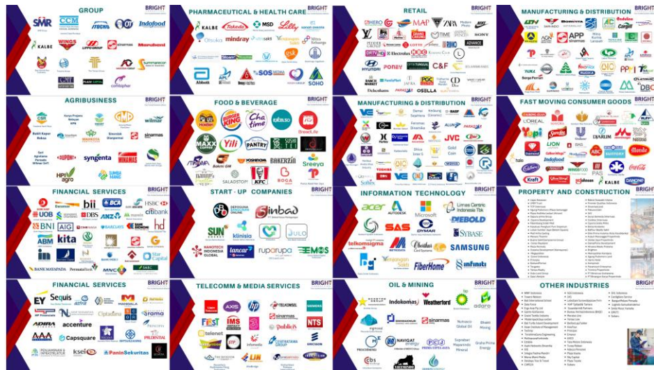
Gambar 2. 3 Daftar Klien Bright Consulting berdasarkan sektor Industri

Setelah adanya kesepakatan dalam kontrak dengan klien, proses Headhunting di Bright Consulting dilakukan dengan mempelajari brief yang diberikan klien untuk lebih memahami kebutuhan klien. Kemudian, Tim Bright Consulting akan mulai melakukan talent mapping , yang merupakan proses dimana Tim Bright Consulting mengumpulkan kandidat-kandidat sesuai dengan kebutuhan klien. Pencarian kandidat dilakukan melalui LinkedIn atau mouth to mouth recommendation . Setelah melalui proses seleksi secara internal, Tim Bright Consulting akan mengajukan kandidat-kandidat terpilih kepada klien.