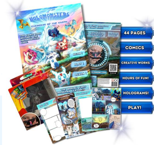
Gambar 2.3 Holomonsters Hologram Comic No. 1

Dari kesuksesan Holomonsters, mereka berencana untuk mulai memproduksi serial film animasi yang dimulai dengan cerita komik yang telah diproduksi oleh Nouverior. Komik Holomonsters memadukan fantasi, aksi, dan pesan moral untuk kehidupan nyata, setiap edisi juga mencakup aktivitas interaktif untuk menginspirasi anak-anak. Di beberapa halaman komik, terdapat QR yang dapat dipindai dengan menggunakan aplikasi game Holomonsters dan proyektor hologram. Setelah dipindai, para Holomonsters akan hidup sebagai hologram di depan mata pengguna. Komik pertama mereka yang berjudul, “ Guardians of the Earth – No. 1 ”, menceritakan Holomonsters melindungi alam dan kehidupan di Bumi dari ancaman kekuatan gelap, World of Shadows . Pembelian komik ini juga akan mencakup, proyektor hologram, Holomonsters trading cards , Holomonsters booster pack , dan akses untuk game Holomonsters.