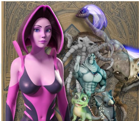
Gambar 2.5 Creibaye by TOPDECK

Selama lebih dari 4 tahun, proyek cinematic novel ini dirancang di Amerika Serikat. Proyek ini awalnya dimulai dari sebuah situs web freelance, yaitu Fiverr. Sesuai dengan ide dan imajinasi direktur proyek Creibaye, Nouverior berusaha menghasilkan produk aset 3D dan animasinya yang berkualitas tinggi dengan tawaran ini.