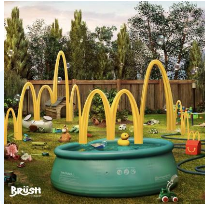
Gambar 2.5 Advertisement Campaign McDonald's Happy Meal (n.d)

Karya ini merupakan visual untuk advertisement Happy Meal milik brand McDonald's yang dibuat oleh Brush Studio bekerjasama dengan Studio Tigabelas. Karya ini menggabungkan teknik fotografi dan ilustrasi, menampilkan suatu lokasi yang dipenuhi mainan anak-anak dan dihiasi dengan variasi logo McDonald's yang berbentuk M. Logo McDonald's ini memenuhi bidang karya dengan lengkungan yang berbeda-beda, memberikan kesan adanya pergerakan yang aktif. Namun lengkungan ini semakin lama semakin menurun hingga stabil dan terhubung dengan bentuk huruf M pada bagian atas packaging Happy Meal. Pesan yang ingin disampaikan dari campaign ini adalah bagaimana Happy Meal cocok untuk menemani anak-anak yang cenderung aktif dan memiliki banyak energi, karena anak-anak akan tenang dan menghentikan aktivitas mereka untuk memakan Happy Meal yang sangat mereka sukai.