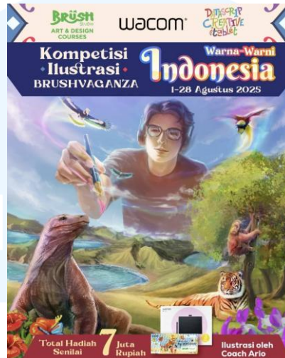
Gambar 2.6 Ilustrasi BRUSHVAGANZA Warna-Warni Indonesia (2025)

promosional segala kegiatan mereka. Berikut beberapa portofolio event Brush Studio yang diambil dari laman Instagram @brushillustration: