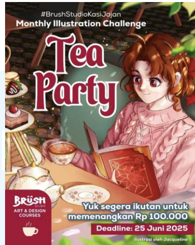
Gambar 2.7 Ilustrasi BKJ Tea Party (2025)

BKJ atau Brush Studio Kasih Jajan adalah event bulanan Brush Studio. Event ini utamanya diadakan untuk siswa dan komunitas Brush Studio, tetapi juga terbuka untuk umum. Brush Studio mengadakan challenge bagi partisipan event ini untuk membuat sebuah karya ilustrasi sesuai dengan tema yang ditentukan Brush Studio, yang berbeda-beda setiap bulannya. Tema event BKJ pada bulan Juni 2025 adalah Tea Party . Post Instagram untuk mempromosikan acara ini dibuat dengan memadukan aset ilustrasi digital dengan desain grafis. Aset ilustrasi menampilkan karakter perempuan yang terlihat sedang meminum teh ditemani dengan kudapan yang diletakkan pada tea set yang seringkali terlihat pada kegiatan afternoon tea , memberikan nuansa yang elegan tapi santai.