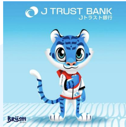
Gambar 2.4 Mascot Design J Trust Bank (2020) Sumber: https://www.instagram.com/p/C0_dC_-puXL/

Karya ini merupakan desain maskot yang dibuat dalam rangka partisipasi lomba desain maskot yang diselenggarakan oleh PT Bank JTrust Indonesia Tbk (J Trust Bank) pada tahun 2020. Periode perlombaan ini dimulai dari 5 September sampai dengan 20 November 2020. Brush Studio mendesain sebuah maskot yang berupa karakter harimau berwarna biru mengikuti tema lomba yang diadakan yaitu blue tiger . Konsep dari maskot yang ditetapkan adalah menggunakan warna biru yang merupakan warna khas brand J Trust Bank yang menyimbolkan kepercayaan, mendukung branding J Trust Bank sebagai bank yang bisa dipercaya, memberikan rasa aman dan nyaman. Desain maskot harimau yang dibuat oleh Brush Studio juga mengandung unsur budaya Indonesia dalam motif bulu harimau yang menyerupai Batik Parang dan juga baju hoodie maskot yang memiliki warna merah dan putih. Merah putih pada hoodie maskot juga menyerupai bendera Jepang karena bentuk merah yang menyerupai setengah lingkaran.