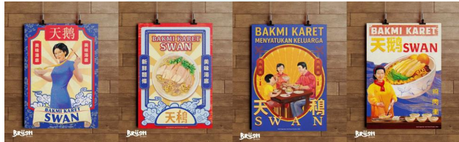
Gambar 2.3 Poster Bakmi Karet Swan (2025)

dan desain grafis. Berikut beberapa proyek Brush Studio untuk kebutuhan klien eksternal berdasarkan post Instagram @brushstudio.id: