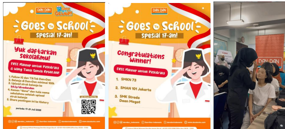
Gambar 2.4 Konten Dan+Dan Goes To School

Portofolio program ini ditampilkan melalui dua bentuk konten, yaitu after movie dan feeds Instagram. After movie dibuat untuk merangkum kegiatan secara menyeluruh dalam bentuk video yang berisikan ringkasan kegiatan make-up di sekolah yang sudah dipilih sebagai pemenang. Sedangkan konten feeds Instagram digunakan untuk menyampaikan informasi program secara singkat mengenai program, keuntungan serta pengumuman pemenang.