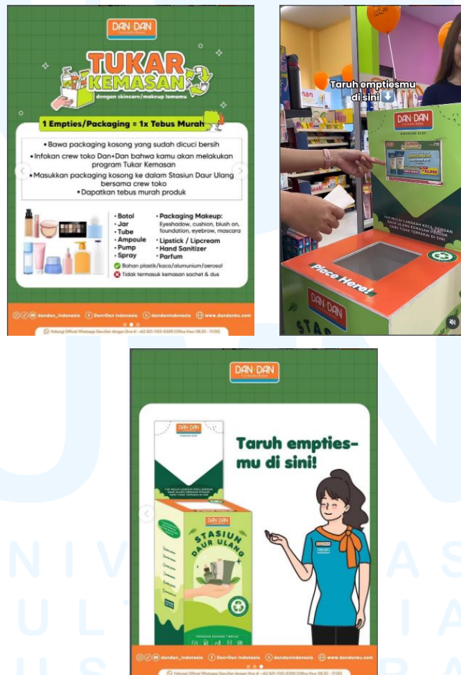
Gambar 2.3 Konten Program Kampanye Tukar Kemasan

terdekat, agar kemasan tersebut dapat disalurkan ke stasiun daur ulang yang telah disediakan. Inisiatif ini bertujuan untuk mengurangi jumlah sampah kemasan sekali pakai serta meningkatkan kesadaran konsumen terhadap pentingnya pengelolaan limbah secara bertanggung jawab. Selain berfokus pada aspek keberlanjutan lingkungan, program ini juga dilengkapi dengan penawaran promosi berupa kegiatan tebus murah yang bekerja sama dengan mitra brand tertentu dan memberikan potongan harga hingga 45% kepada pelanggan yang menukarkan kemasan bekas mereka.