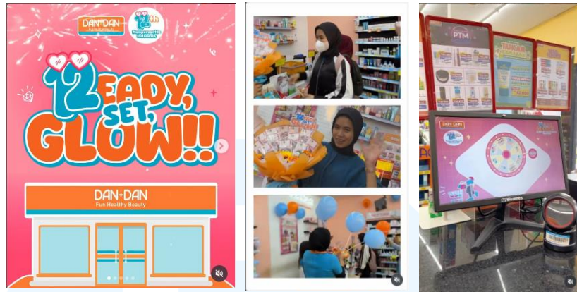
Gambar 2.6 Konten Program 12 Eady Set Glow

Dan+Dan juga menghadirkan promo Anniversary sebagai bentuk apresiasi kepada pelanggan, dengan hadiah utama bernilai belasan juta untuk 12 pelanggan setia. Promo ini berlaku hanya pada hari perayaan, sehingga menambah kesan spesial pada program tersebut. Portofolio Dan+Dan ini berupa after movie yang berisikan ringkasan kegiatan, ajakan dan recap program selama satu tahun yang sudah dijalankan oleh Dan+Dan maupun kolaborasi bersama brand. Dokumentasi visual juga dilihat melalui konten penjelasan tema 12 Eady Set Glow dan keuntungan yang bisa didapatkan oleh pelanggan di hari tersebut.