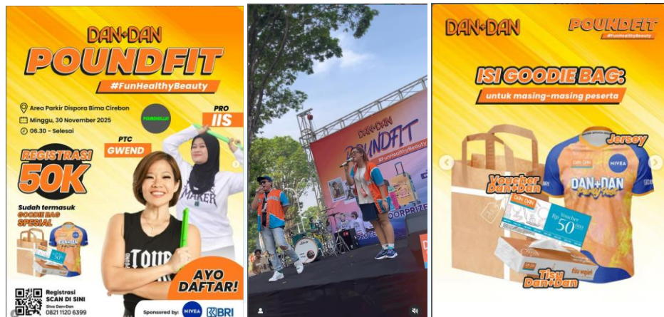
Gambar 2.5 Konten Dan+Dan Goes To School

Dokumentasi dari kegiatan ini didapatkan penulis dari konten di Instagram, mulai dari foto suasana acara hingga after movie yang menampilkan rangkaian aktivitas bersama peserta. Publikasi ini memperlihatkan bahwa kegiatan poundfit tidak hanya menjadi ajang olahraga, tetapi juga bentuk upaya Dan+Dan untuk membangun kedekatan dengan komunitas secara lebih santai dan relevan dengan tren gaya hidup sehat. Seluruh konten foto, video, dan after movie tersebut menjadi bagian dari portofolio kegiatan Dan+Dan.