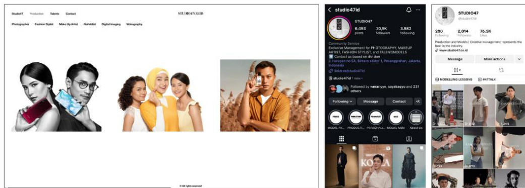
Gambar 2.4 Media Official Studio Empat Tujuh

Sebagai agency model & talent , Studio Empat Tujuh sudah pernah bekerja sama dengan sangat banyak brand ternama yaitu, brand kecantikan dan perawatan kulit seperti Loreal, Indomie, Pixy cosmetic, POND'S Men, Biore, Something, Maybelline, Makeover, Rose All Day, Npure, ESQA, dan banyak beauty brand ternama lainnya; magazine atau majalah seperti Bazaar, Elle, Cosmopolitan, Dewi Magazine, dan Fimela; designer brand seperti Ivan Gunawan, Sebastian Gunawan, Votum, Hian Tjen, Iwan Tirta, Batik Keris, Buttonscarves, Jan Sober, dan Benang Jarum. Sedangkan sebagai production house , Studio Empat Tujuh juga telah menaungi berbagai brand ternama seperti Loreal, La Roche Posay, Maybelline, Verdilab, Dove, Matrix, POND'S, Garnier, dan Tomoro coffee.