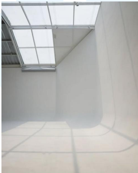
Gambar 2.2 Studio Limbo

Studio Empat Tujuh juga menyewakan studionya untuk umum. Studio dengan luas 12 x 13 meter dengan skylight setinggi enam meter. Studio ini memiliki jenis limbo yang berarti studionya didesain dengan background polos dominan putih tanpa sudut, biasanya melengkung di bagian lantai dan dinding sehingga memberikan efek infinity background . Tidak hanya menyediakan studio dan peralatan fotografi dan videografi, namun di Studio Empat Tujuh juga terdapat dua personal space yang bisa digunakan sebagai ruang tunggu model/ talent dan juga sebagai tempat makeup & hairdo karena dilengkapi dengan cermin besar serta lampu yang memadai.