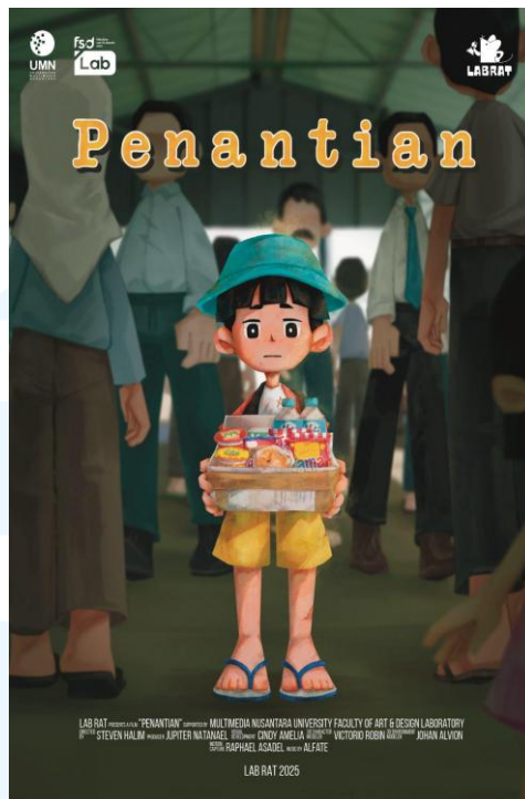
Gambar 2.4 Konten Instagram Laboratorium FSD UMN

Proyek animasi pendek “Penantian” ini merupakan Animasi 3D yang mempunyai durasi selama 2 menit 30 detik. Dalam proyek animasi pendek ini menceritakan mengenai perjuangan seorang anak kecil pedagang asongan bernama Adi dalam mencari nafkah di stasiun kereta Pamantjar. Sejak kehilangan kedua orang tuanya, Adi menanggung beban dalam menafkahi diri sendiri dan adiknya, Ayu yang baru berumur 6 tahun. Setiap harinya, Adi terpaksa untuk pergi bekerja menjadi pedagang asongan hingga senja datang dengan tujuan sederhana yaitu, bertemu dengan adiknya.