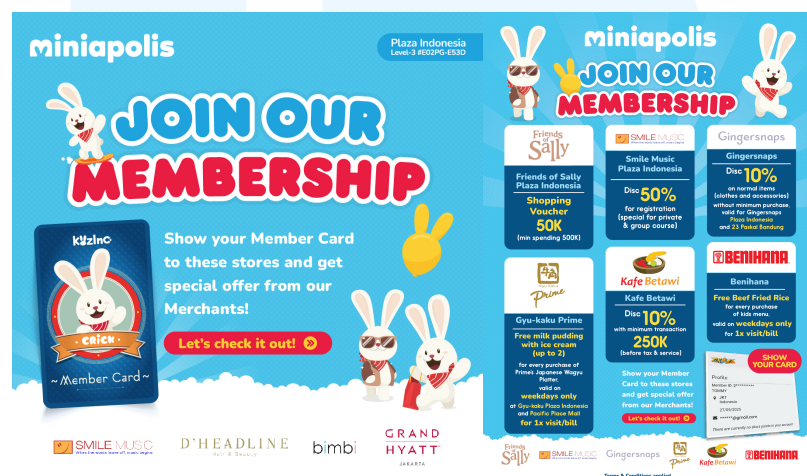
Gambar 2.4 Membership Miniapolis

Membership Miniapolis dapat memanfaatkan banyak keuntungan, seperti harga tiket bermain yang lebih murah, akses preferensial ke area tertentu, dan diskon untuk brand-brand yang bekerja sama dengan Miniapolis. Melalui aktivitas interaktif dan edukatif, program ini juga bertujuan untuk meningkatkan hubungan antara merek dan keluarga pengunjung.