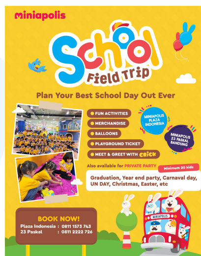
Gambar 2.8 School Field Trip Miniapolis

School Field Trip merupakan sebuah acara yang diadakan oleh Miniapolis dalam rangka kerja sama dengan sekolah-sekolah yang telah melakukan perjanjian sebelumnya. Acara ini diadakan dengan menggabungkan unsur edukasi dan rekreasi yang bertujuan untuk memberikan pengalaman belajar yang menyenangkan bagi anak-anak. Acara ini juga melahirkan berbagai merchandise dan balon lucu yang memiliki ciri khas Miniapolis guna meningkatkan promosi halus.