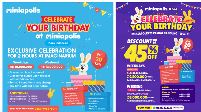
Gambar 2.6 Birthday Miniapolis

Pada Miniapolis, layanan Birthday Party dirancang untuk menghadirkan momen perayaan yang ceria, aman, dan edukatif bagi anak-anak. Acara ulang tahun diselenggarakan langsung di area bermain Miniapolis, sehingga anak-anak dapat menikmati berbagai wahana yang tersedia dalam satu paket perayaan. Selain itu, Miniapolis juga menawarkan Golden Ticket sebagai bagian dari paket, yang memberikan akses tambahan ke permainan lainnya yang disediakan oleh Miniapolis. Miniapolis berusaha untuk membuat ulang tahun yang tidak hanya menyenangkan tetapi juga berkesan bagi anak-anak dan keluarga dengan memiliki suasana yang penuh warna dan aktivitas yang mendorong kreativitas.