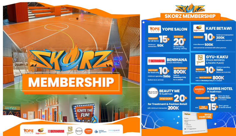
Gambar 2.5 Membership Skorz

Melalui program membership , Miniapolis dan Skorz dapat membangun hubungan jangka panjang dengan pengunjung melalui pengalaman yang lebih intim dan menguntungkan. Miniapolis dan Skorz dapat membangun hubungan jangka panjang dengan pengunjung melalui pengalaman yang lebih intim dan menguntungkan. Selain itu, membership membantu perusahaan memahami kebutuhan dan preferensi pengunjung sehingga dapat terus mengembangkan layanan yang relevan dan sesuai dengan perkembangan industri hiburan keluarga.