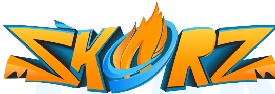
Gambar 2.2 Logo SkorZ

Sementara itu, SAI memiliki tujuan untuk menyediakan lingkungan untuk individu yang berjiwa muda agar dapat meluapkan kelebihan energi mereka dan menjaga kesehatan fisik dengan melakukan berbagai macam aktivitas fisik yang menyenangkan. Maka dari itu, dibentuklah arena hiburan olahraga dengan visi membangun komunitas yang dinamis dimana setiap individu yang berjiwa muda terinspirasi untuk unggul secara akademis, menjaga kesehatan fisik, dan memberikan kontribusi yang berarti bagi dunia sekitar. Sementara itu, misi yang ditujukan oleh SAI yaitu membangkitkan potensi individu berjiwa muda dengan mempromosikan gaya hidup aktif, mendorong pengembangan keterampilan hidup, dan memupuk keterlibatan sosial dan komunitas.