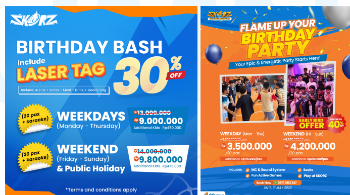
Gambar 2.7 Birthday SkorZ

Pada Miniapolis, layanan Birthday Party dirancang untuk menghadirkan momen perayaan yang ceria, aman, dan edukatif bagi anak-anak. Acara ulang tahun diselenggarakan langsung di area bermain Miniapolis, sehingga anak-anak dapat menikmati berbagai wahana yang tersedia dalam satu paket perayaan. Selain itu, Miniapolis juga menawarkan Golden Ticket sebagai bagian dari paket, yang memberikan akses tambahan ke permainan lainnya yang disediakan oleh Miniapolis. Miniapolis berusaha untuk membuat ulang tahun yang tidak hanya menyenangkan tetapi juga berkesan bagi anak-anak dan keluarga dengan memiliki suasana yang penuh warna dan aktivitas yang mendorong kreativitas.