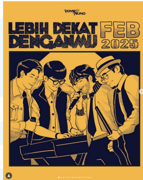
Gambar 2.4 Cover Recap Bulan Februari 2025 Yovie & Nuno

bulanan memiliki gayanya masing-masing dengan penekanan utamanya pada cover postingan. Berikut ini adalah cover recap untuk bulan September 2025.