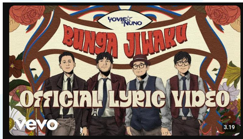
Gambar 2.6 Thumbnail Official Lyric Video “Bunga Jiwaku”

“Bunga Jiwaku” merupakan lagu ikonik Yovie & Nuno yang pertama kali dirilis pada 2007 dan kembali dihadirkan dalam format lyric video oleh YWMF pada 7 Februari 2025, diterbitkan oleh Sony Music Publishing Indonesia .