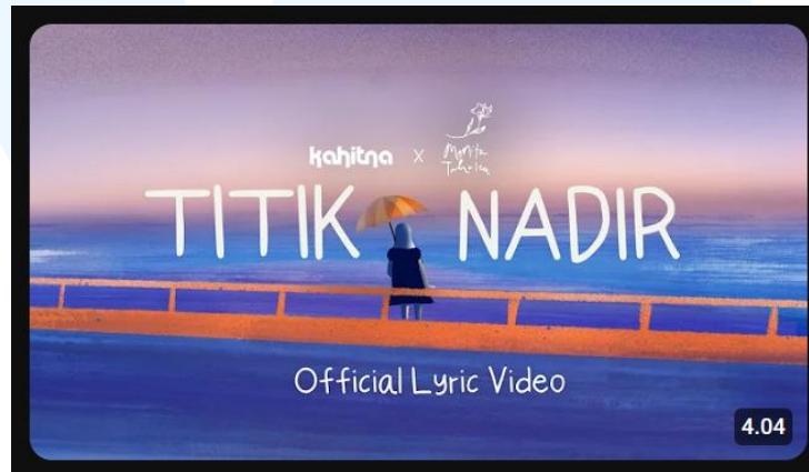
Gambar 2.3 Thumbnail Official Lyric Video “Titik Nadir”

“Titik Nadir” merupakan lagu terbaru dari Kahitna yang dirilis pada tahun 2025 melalui akun YouTube Kahitna Official dan diproduksi oleh YWMF. Lagu ini memperlihatkan warna baru Kahitna dengan nuansa pop-jazzy khas, namun dikemas lebih modern dengan sentuhan elektronik ringan.