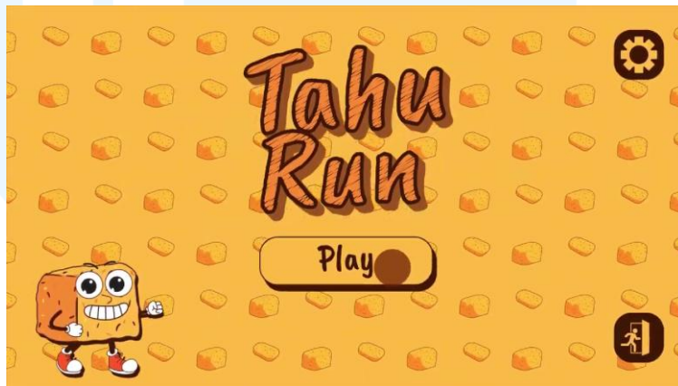
Gambar 2.5 Portofolio Tahu Run

Game ini game B2B untuk perusahaan Tahu Run, sebuah perusahaan di bidang FnB yang menjual tahu. Tahu Run adalah perusahaan yang menjual tahu yang terasa renyah, dengan cabe yang pedas. Tujuan dari game ini adalah mempromosikan produknya dengan cara yang unik, yakni memberikan kesan bahwa Tahu Run adalah brand dengan mascot yang menyenangkan, kemudian ia memiliki tahu yang crispy . Dalam game ini, pemain dapat memainkan mascot dari Tahu Run untuk berlari kencang menghindari setiap halangan dan mengumpulkan poin berupa tahu di sebuah dapur.