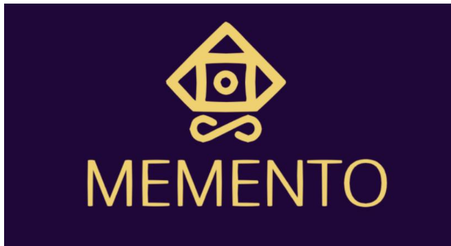
Gambar 2.1 Logo PT Memento Game Studios.

Visi dan misi dari PT Memento Game Studios terdapat di dalam website resminya. Visinya adalah untuk menjadi seorang innovator di dalam industri gaming , dengan pengalaman yang unik dan berkesan yang menggabungkan teknologi dan kreativitas. Sementara dalam misinya, terdapat tiga misi, yaitu pertama untuk membuat solusi gaming yang menarik dan immersif dari konsep yang visioner. Kedua, untuk membuat pengalaman gaming yang berkesan untuk para pemain di belahan-belahan dunia. Dan yang ketiga adalah, untuk membantu bisnis dengan solusi gaming yang inovatif dan bersifat custom-made sehingga mendukung pertumbuhannya.