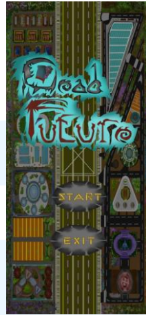
Gambar 2.9 Portofolio Game Dead Future Sumber: Tantinos/ PT Memento Game Studios (2025)