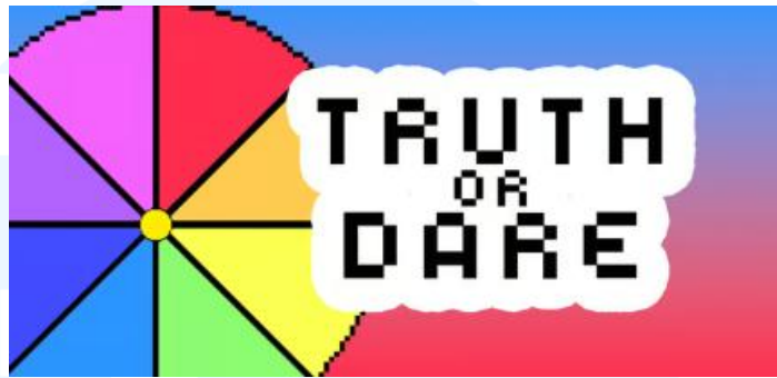
Gambar 2.6 Portofolio Game Truth or Dare

teman-temannya. Game ini didesain untuk dimainkan bersama-sama dengan banyak pemain, dirancang dengan berbagai in-app purchases . Dengan desain berupa pixel arts , game ini memiliki desain yang minimalis dan bewarna-warni.