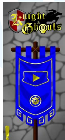
Gambar 2.10 Portofolio Game Knight and Ghoul

Knight and Ghoul adalah sebuah game yang dibuat oleh PT Memento Game Studios untuk publik dengan desain bird poin of view . Dalam permainan ini, pemain diajak menjadi karakter Sir Michael, seorang ksatria, dalam mengusir dan mengalahkan para hantu dalam sebuah hutan terkutuk. Pemain diajak mengendarai kudanya sebagai seorang ksatria, menembaki para hantu dan mendapatkan setiap poin dalam setiap perjalanannya.