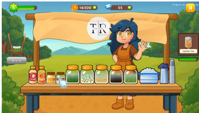
Gambar 2.3 Portofolio Teh Rasa Original