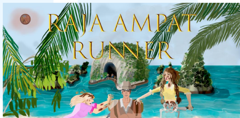
Gambar 2.8 Portofolio Game Raja Ampat Runner

Raja Ampat Runner adalah sebuah game yang dibuat oleh PT Memento Game Studios untuk publik. Game ini memiliki tema tentang petualangan karakter yang dimainkan oleh pemain di Raja Ampat, dimana seorang karakter sedang mencari harta karun, tetapi ia menemukan para monster. Pemain diharuskan berlari menghindari para monster sembari harta karun. Permainan ini dapat dimainkan secara mobile landscape size .