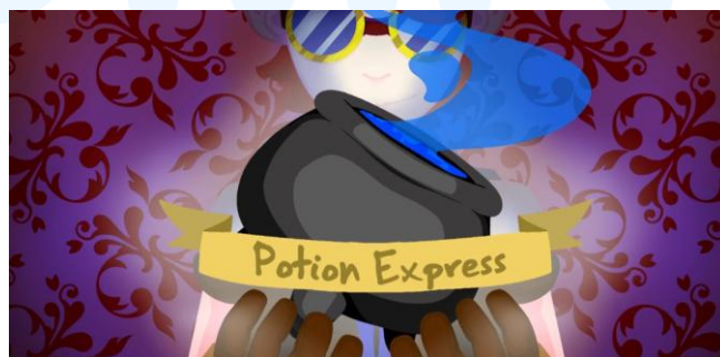
Gambar 2.7 Portofolio Game Potion Express

Game Potion Express merupakan sebuah permainan dimana seorang pemain membuat sebuah toko yang menjual berbagai ramuan herbal. Game ini menggunakan desain ilustrasi yang bewarna-warni dan cerah, dengan biru dan ungu sebagai warna utama. Dalam game ini, pemain diajak untuk membuat ramuan, menjualnya, hingga belajar mengatur sumber daya yang dimilikinya. Game ini didesain untuk membuat pemain menjadi pandai mengatur sumber daya, membuat produk berupa ramuan, dan belajar menjualnya, dengan cara bermain secara perorangan.