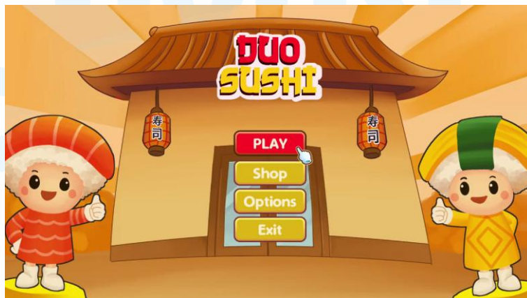
Gambar 2.4 Portofolio Nduo Sushi

Game ini adalah game yang dibuat dalam rangka menunjang penjualan dari Duo Sishi, sebuah perusahaan di bidang FnB. Perusahaan ini ingin mempromosikan makanan berupa sushi kepada para konsumennya, oleh karena itu, ia bekerjasama dengan PT Memento Game Studios dalam membuat game . Dalam game ini, pemain dapat membuat berbagai macam sushi pesanan para pelanggan, kemudian pelanggan membayar dengan koin emas. Setiap koin emas dapat dikumpulkan untuk membeli berbagai fasilitas operasional dari restoran, seperti meja, bangku, dan lain sebagainya.