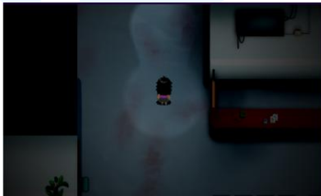
Gambar 2.11 Portofolio Game Lost Day

Lost Day adalah sebuah game yang dibuat oleh PT Memento Game Studios untuk publik dalam bentuk PC Games . Permainan ini mengambil tema akhir dunia, ketika dunia menjadi horor, dan pemain menjadi karakter Lina, seorang perempuan yang harus menemukan tujuan dan harapan hidup di tengah traumanya. Dalam permainan ini, pemain berjalan-jalan di ruangan yang gelap nan horor menghadapi segala jenis hantu dan monster. Desain dari permainan ini dibuat dalam bentuk format pixel 2D .