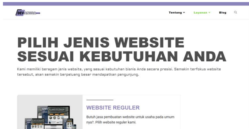
Gambar 2.4 Website Devanoda

kesuksesan bisnis milik klien. Pada website Devanoda terdapat layanan service jasa website.