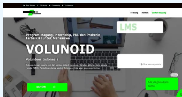
Gambar 2.3 Website Homepage Volunoid Sumber: alterindonesia.co.id 2025

Perusahaan Volunoid telah mengembangkan teknologi LMS secara terus menerus memberikan pengalaman terbaik untuk para mahasiswa dan pelajar yang ingin mendaftar magang dengan mudah. Volunoid (PT Alter Teknologi Indonesia) menciptakan layanan meliputi pembuatan website, aplikasi seluler, game, hingga program pelatihan teknologi informasi. Salah satu Portofolio, Volunoid menciptakan situs website program magang yang berisi pendaftaran, tentang perusahaan dan informasi lainnya terkait program magang tersebut.