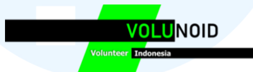
Gambar 2.1 Logo Volunoid

Volunoid memiliki visi dan misi yaitu untuk menjadi penyedia program magang terbaik nomor satu di Indonesia, dengan menghadirkan berbagai fitur dan sistem pengelolaan yang mampu memberikan pengalaman nyata bagi peserta, sekaligus meningkatkan kualitas dan kompetensi mereka. Sedangkan untuk misi, menyempurnakan materi pembelajaran agar setiap sesi pelatihan, baik berupa teori maupun praktik, dapat berlangsung lebih efektif dan memberikan hasil yang optimal bagi peserta. Selain itu, perusahaan melengkapi platform dengan berbagai fitur penyediaan dokumen, baik dalam bentuk softcopy maupun fisik, sehingga kebutuhan peserta magang terhadap beragam jenis dokumen dapat terpenuhi dengan baik. Dalam misi mereka juga memberikan pengawasan yang terbaik kepada peserta magang agar mereka mengikuti aturan dan benar-benar mengerjakan atas kesempatan untuk memegang pekerjaan yang sudah diberikan oleh pihak perusahaan kepada mereka (Volunoid.com).