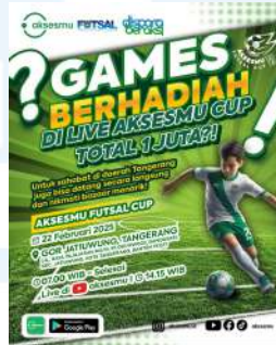
Gambar 2. 9 Post Ajakan Futsal Cup Aksesmu

Acara ini disiarkan langsung melalui live stream YouTube Aksesmu agar masyarakat dapat meramaikan dan memberikan dukungan kepada para peserta dalam Aksesmu Futsal Cup 2025. Yang menonton pertandingan futsal melalui live stream YouTube Aksesmu tidak hanya menikmati pertandingan, tetapi juga berkesempatan memperoleh hadiah uang tunai.