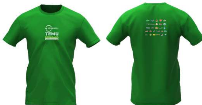
Gambar 2. 4 T-shirt Temu Pedagang 2024

Aksesmu juga membuat t-shirt khusus Temu Pedagang kepada OBA yang berpartisipasi dalam acara ini. T-shirt Temu Pedagang bisa digunakan untuk perempuan dan laki-laki.