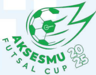
Gambar 2. 7 Logo Aksesmu Futsal Cup

Aksesmu Futsal Cup merupakan turnamen futsal yang diselenggarakan oleh Aksesmu dalam rangka merayakan ulang tahun Aksesmu, turnamen ini menjadi sarana bagi generasi muda untuk menunjukkan bakat dan sportivitas mereka dalam bidang olahraga. Untuk penyelenggaraan Aksesmu Futsal Cup 2025, Aksesmu berkolaborasi dengan Asosiasi Futsal Kota Tangerang (AFK). Pemenang Futsal Cup didaftarkan ke situs web FutsCore.