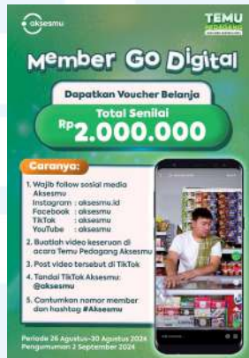
Gambar 2. 5 Flyer Lomba Member Go Digital Temu Pedagang 2024

Di acara ini, Aksesmu mengajak OBA untuk mengikuti lomba membuat video konten Member Go Digital selama acara berjalan dan edit yang paling menarik serta di upload di media sosial. Pemenang akan mendapatkan hadiah spesial. Aksesmu membuat flyer lomba tersebut agar hanya OBA yang hadir di Temu Pedagang yang dapat berpartisipasi.