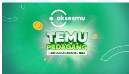
Gambar 2. 6 Thumbnail YouTube Temu Pedagang 2024

Setelah acara ini selesai, Aksesmu membuat video yang berisi rangkuman kegiatan serta pengalaman-pengalaman menyenangkan selama di Temu Pedagang, yang kemudian dibagikan melalui media sosial perusahaan sebagai bentuk dokumentasi dan promosi kegiatan.