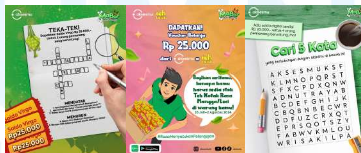
Gambar 2. 10 MaBar Aksesmu

MaBar Aksesmu atau Main Bareng Aksesmu adalah mini game yang biasanya diunggah di sosial media Aksesmu. Jenis permainan yang disajikan beragam, seperti cari kata, teka-teki, dan lainnya. Setiap member yang berpartisipasi berkesempatan untuk memenangkan hadiah menarik dari Aksesmu.