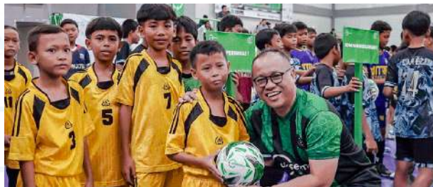
Gambar 2. 8 Aksesmu Futsal Cup

Turnamen ini diselenggarakan untuk menumbuhkan semangat kompetisi yang sehat, kebersamaan, serta pengembangan keterampilan siswa. Hadiah yang diberikan meliputi bantuan pembinaan untuk sekolah yang memiliki keterbatasan dana, serta sertifikat prestasi yang dapat digunakan sebagai jalur prestasi ke tingkat SMP atau SMA. selain menjadi ajang kompetisi bagi peserta, turnamen ini juga menghadirkan hiburan bagi orang tua dan pendukung, yang dapat menikmati acara dan mengunjungi bazar yang diadakan.