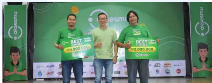
Gambar 2. 3 Acara Temu Pedagang 2024

Temu Pedagang adalah acara tahunan yang diselenggarakan oleh Aksesmu, untuk pedagang warung yang sudah menjadi member Outlet Binaan Aksesmu (OBA). Acara ini diselenggarakan dalam rangka memperingati Hari UMKM Nasional. Tujuan acara ini untuk memperkuat hubungan antara Aksesmu, mitra pemasok, dan para pedagang binaan.