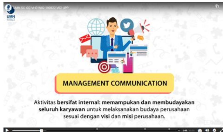
Gambar 2.5 Screenshot Video Animasi dari Portofolio BPP

Selanjutnya di gambar ini merupakan screenshot dari dokumentasi perusahaan BPP yang menampilkan salah satu contoh penyampaian materi yang menunjukkan pergerakan animasi aset vektor yang diterapkan di sebuah video dari salah satu mata kuliah pada e-learning . Media animasi ini merupakan salah satu pengembangan BPP dalam memproduksi ilustrasi vektor yang digunakan sebagai aset untuk animasi video sbagai penyampaian materi yang diterapkan pada e-learning untuk mahasiswa.