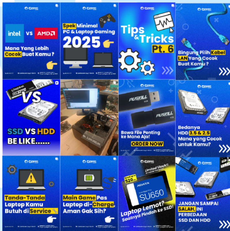
Gambar 2.4 Desain Post Informatif

Karya-kini merupakan bagian dari desain post informatif dan edukatif yang bertujuan untuk memberi audiens informasi dan wawasan baru. Pesan disampaikan secara efektif melalui tampilan visual yang menarik dan mudah dipahami. Desain-desain ini memiliki nilai edukatif, sehingga audiens dapat memahami materi dengan lebih jelas dan interaktif.