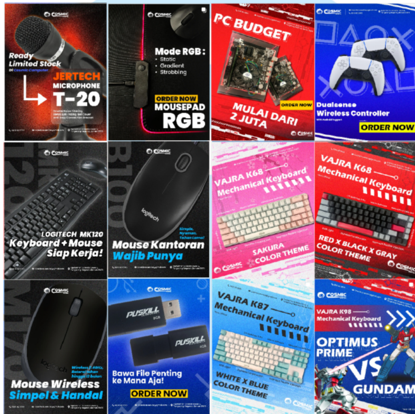
Gambar 2.5 Desain Poster Produk

diharapkan akan meningkatkan minat dan kepercayaan pelanggan terhadap Cosmic Computer.