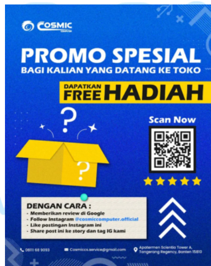
Gambar 2.3 Poster Promo Spesial

Karya ini merupakan bagian dari promosi untuk customer yang datang ke toko dan memberi ulasan mengenai pelayanan langsung dari ownernya dan mendapatkan free barang produk random jika customer mengikuti langkah-langkah yang diberikan oleh mereka.