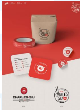
Gambar 2.4 Redesign Logo Charles Siu Sumber: www.justdesign.id/portfolio/charles-siu-redesign-logo

dikenal sebagai sebuah restoran yang menyajikan berbagai menu daging panggang khas Tiongkok. Beberapa makanan yang disajikan antara lain adalah nasi Hainan, nasi samcan, nasi Ma Ling, nasi lap chiong, nasi campur, dan lain-lain. Produk dari Charles Siu dapat dipesan langsung di restoran, maupun secara online melalui aplikasi Gojek.