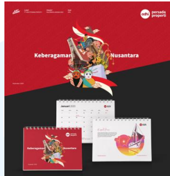
Gambar 2.5 Design Kalender untuk PT Adhi Persada Properti

perusahaan dari perusahaan BUMN Jasa Konstruksi terbesar di Indonesia yaitu PT Adhi Karya (Persero) Tbk (PT Adhi Persada Properti, n.d.).