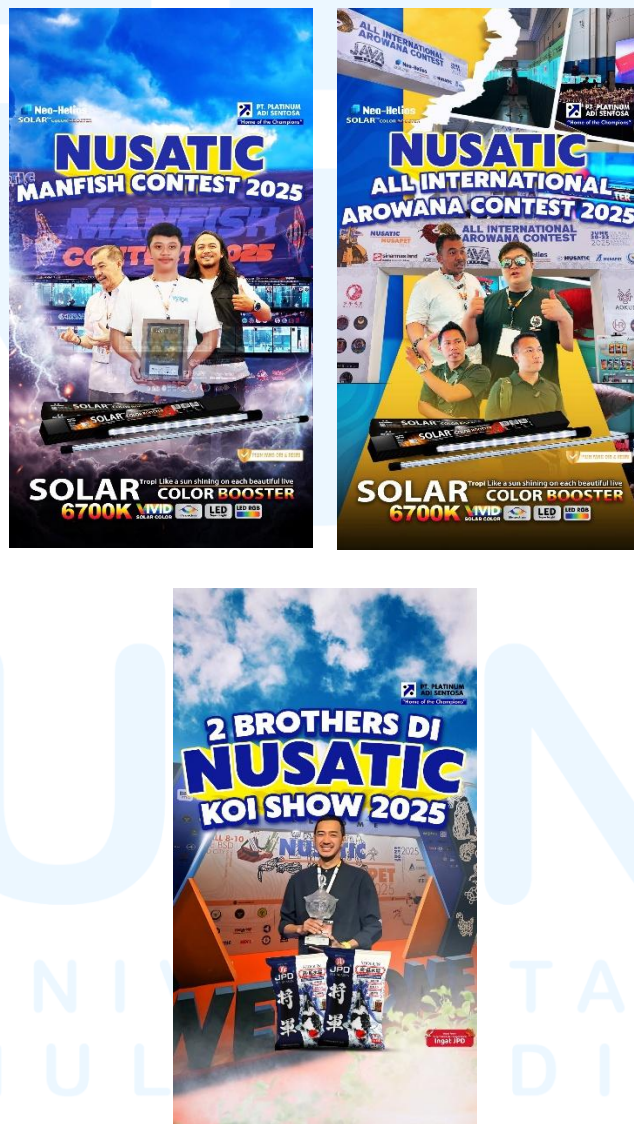
Gambar 2.4 Portofolio Perusahaan

Nusatic 2025 merupakan sebuah acara pameran dan ajang edukasi ikan hias dan hewan peliharaan terbesar di dunia. Nusatic 2025 diadakan pada tanggal 20 sampai 22 Juni 2025 di ICE BSD City. Selain ikan hias, acara ini menampilkan beragam-ragam jenis hewan lainnya seperti reptil, anjing, kucing serta produk-produk terkait.