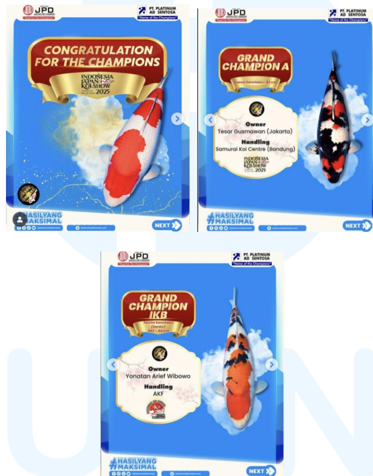
Gambar 2.3 Portofolio Perusahaan

IJKS 2025 merupakan sebuah acara kompetisi ikan koi yang diadakan untuk mempertemukan perternak dan penjual ikan koi, serta menampilkan keindahan ikan-ikan koi yang dipamerkan. IJKS diadakan pada 14 sampai 15 Febuari 2025 di ICC BRIN Bogor.