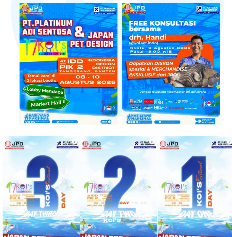
Gambar 2.5 Portofolio Perusahaan

Koi Festival 2025 merupakan sebuah festival dan kompetisi festival ikan koi yang dinilai oleh ahli dari Jepang, Malaysia, dan Thailand. Festival ini berlangsung pada 8-9 Agustus 2025 di Indonesia Design Distric, PIK 2.