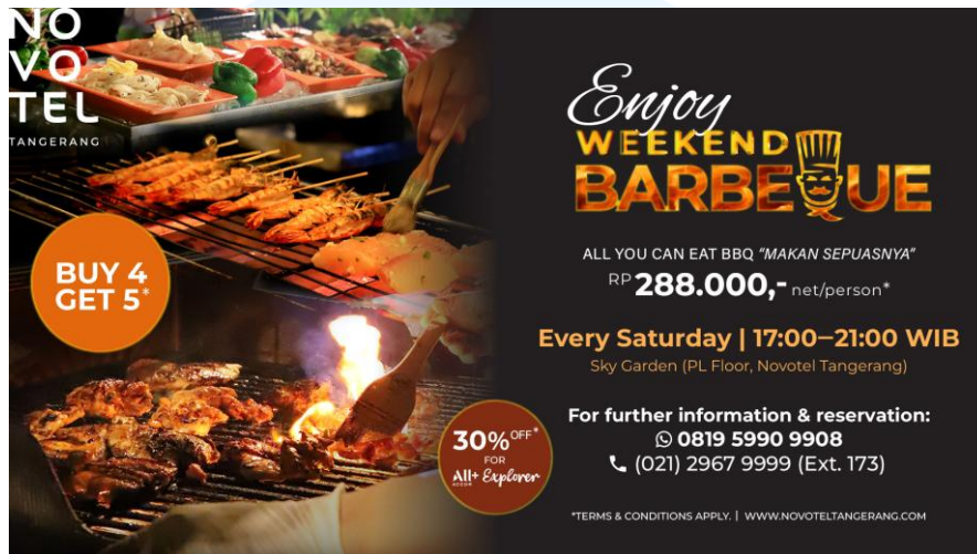
Gambar 2.3 E-Flyer Weekend Barbeque

Weekend Barbeque merupakan salah satu program unggulan yang diselenggarakan setiap hari Sabtu di area Sky Garden Novotel Tangerang. Acara ini dirancang untuk memberikan pengalaman yang santai dengan suasana Bali, dari musik hingga dekorasinya. Selain menikmati berbagai pilihan hidangan barbeque yang disajikan secara langsung oleh chef hotel, para tamu juga dapat menikmati hiburan berbeda setiap minggunya, mulai dari Tari Oleg, Tari Kecak, hingga Fire Dance dll.