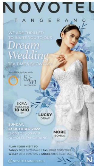
Gambar 2.4 E-Flyer Dream Wedding

Wedding Open House merupakan acara tahunan yang diselenggarakan oleh Novotel Tangerang sebagai wadah bagi calon pengantin untuk mendapatkan inspirasi dan pengalaman langsung dalam merencanakan pernikahan impian mereka. Dalam acara ini, Novotel Tangerang membuka akses bagi para pengunjung untuk melihat langsung kemegahan ballroom, mencicipi hidangan pilihan dari chef hotel, serta bertemu langsung dengan vendor-vendor pernikahan ternama, mulai dari dekorasi, busana pengantin, fotografi, hingga hiburan. Acara ini juga memberikan berbagai penawaran eksklusif, termasuk kesempatan untuk memenangkan cashback, hadiah menarik, maupun potongan harga khusus selama acara berlangsung.