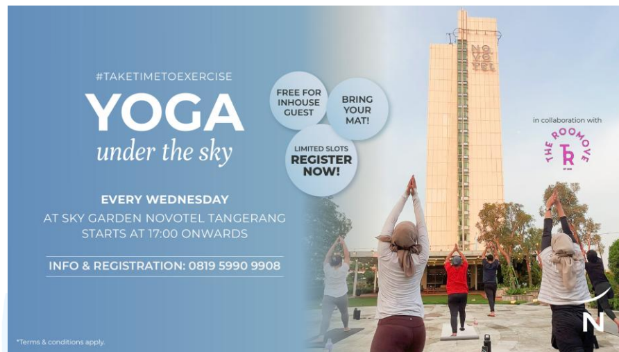
Gambar 2.5 E-Flyer Yoga Under The Sky

Yoga under the sky merupakan program mingguan Novotel Tangerang yang diadakan setiap hari Rabu dan berlokasi di Sky Garden , area rooftop dengan pemandangan kota Tangerang yang menenangkan. Program ini merupakan hasil kolaborasi dengan The Roomove, yang menghadirkan pengalaman yoga yang menyegarkan, menenangkan pikiran. Kegiatan ini terbuka untuk umum, sehingga siapa pun dapat berpartisipasi untuk merasakan pengalaman yoga di ketinggian, namun gratis bagi tamu yang menginap di Novotel Tangerang.