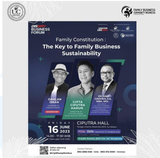
Gambar 2.6 Talkshow Business Forum