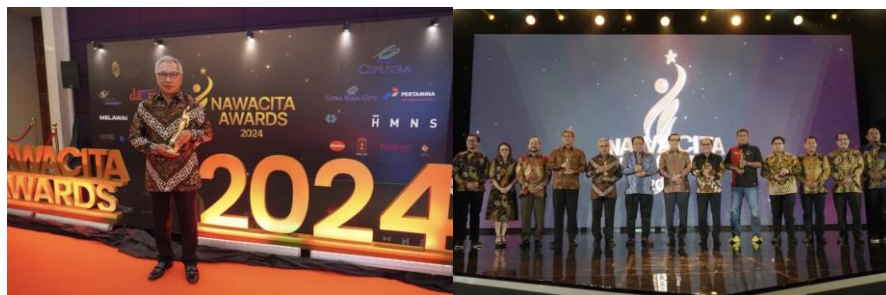
Gambar 2.5 Dokumentasi Nawacita Awards 2024

Gambar diatas merupakan hasil foto dokumentasi Ajang Property Indonesia Award yang dilaksanakan pada tahun 2024. Award tersebut merupakan bentuk apresiasi kepada para stakeholders dari industri properti Ciputra khususnya bagian real estate . Penghargaan ini merupakan salah satu wujud atas inovasi para stakeholders yang konsisten mengimplementasikan pembangunan dalam konsep Sustainability .