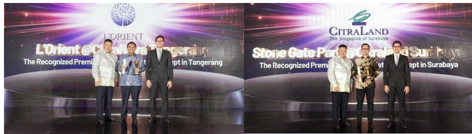
Gambar 2.4 Dokumentasi Ajang Property Indonesia Award 2024