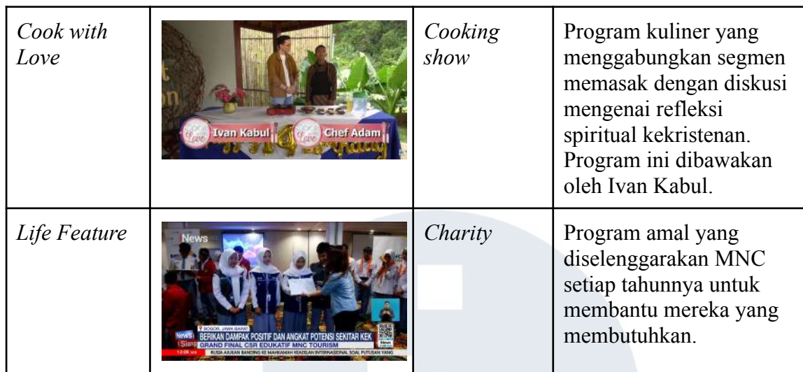
Tabel 2.1 Rincian program LIFE Channel