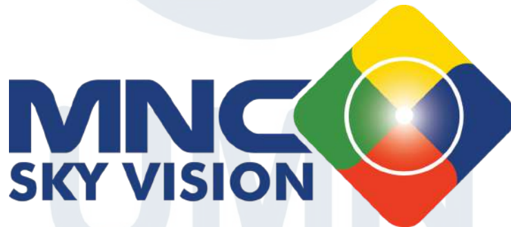
Gambar 2.1 Logo MNC Vision

LIFE Channel merupakan sebuah saluran yang menayangkan program-program rohani Kristen dan Katolik yang tayang perdana pada 10 Februari 2010. LIFE Channel berada di bawah MNC Channels yang merupakan salah satu saluran televisi berlangganan nasional, bagian dari perusahaan PT MNC Sky Vision Tbk. Secara umum, MNC Channels sebagai saluran utama juga menaungi sejumlah saluran lain dengan berbagai kategori tayangan. Saluran-saluran tersebut menayangkan tayangan hiburan mulai dari olahraga, hiburan, musik, budaya, spiritual hingga travel dan kuliner. LIFE Channel merupakan salah satu saluran di MNC Channels yang bertema spiritual atau rohani, khususnya untuk Kristen dan Katolik.