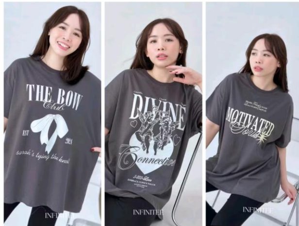
Gambar 2.3 Infinitee Oversized T-shirt Abu Tua