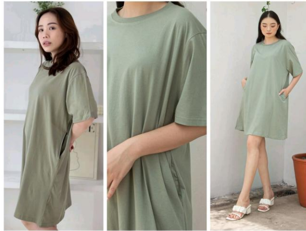
Gambar 2.6 Infinitee Oversized Basic Midi Dress Sage Green

pilihan warna, menjadikan dress ini sebagai salah satu produk unggul yang dimiliki oleh Infinitee.