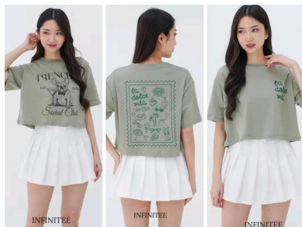
Gambar 2.4 Infinitee Oversized Crop Top Sage Green

Oversized crop top dirancang mengikuti tren fashion kasual modern, menghadirkan potongan crop yang longgar dan stylish sehingga memberikan kesan fleksibel dan modern. Perpaduan bahan katun berkualitas dengan desain yang stylish menjadikan produk ini digemari oleh konsumen muda, terutama perempuan. Oversized crop top juga dapat dipadukan dengan berbagai bawahan seperti celana high-waist atau rok pendek, memberikan kesan yang santai namun tetap modis.