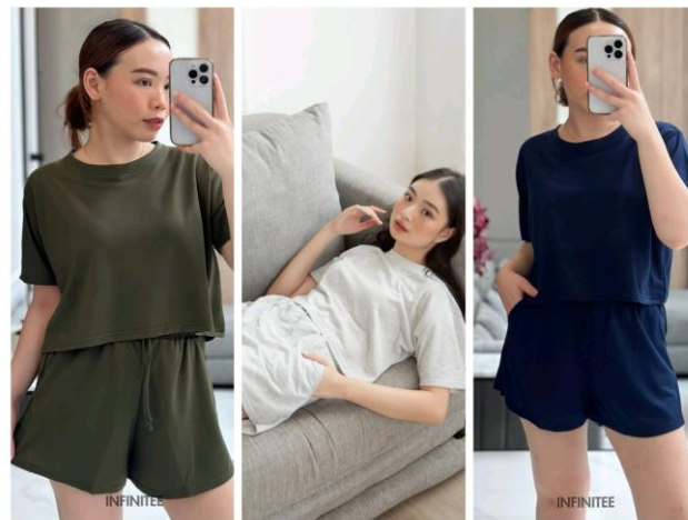
Gambar 2.5 Infinitee Oversized Crop Top Set

Crop top set merupakan pakaian setelan yang terdiri dari crop top dan celana pendek dengan desain yang serasi, menghadirkan tampilan yang praktis serta stylish . Desain yang serasi antara atasan dan bawahan, mempermudah konsumen dalam memadukan pakaian, sehingga dapat membantu konsumen dalam menghemat waktu. Dengan bahan katun yang ringan dan breathable , menjadikan setelan ini sebagai produk yang cocok digunakan dalam berbagai aktivitas. Desainnya yang modis dan mendukung kenyamanan, menjadi daya tarik bagi konsumen muda yang mengutamakan gaya ringkas, modern, namun tetap nyaman digunakan.