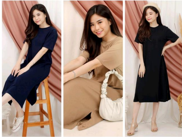
Gambar 2.7 Infinitee Slit Midi Dress

Detail slit pada kedua produk, tidak hanya untuk memperindah penampilan, melainkan juga memberikan kebebasan dan kenyamanan dalam bergerak. Tampilannya yang sederhana dan unik, membuat produk ini menjadi pilihan bagi konsumen yang ingin tampil stylish tanpa terlihat berlebihan. Produk ini menjadi sesuai bagi para konsumen yang menyukai penampilan kasual namun ingin tampil dengan sedikit aksesoris unik dan trendi.