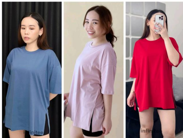
Gambar 2.8 Infinitee High Slit Oversized T-shirt

Detail slit pada kedua produk, tidak hanya untuk memperindah penampilan, melainkan juga memberikan kebebasan dan kenyamanan dalam bergerak. Tampilannya yang sederhana dan unik, membuat produk ini menjadi pilihan bagi konsumen yang ingin tampil stylish tanpa terlihat berlebihan. Produk ini menjadi sesuai bagi para konsumen yang menyukai penampilan kasual namun ingin tampil dengan sedikit aksesoris unik dan trendi.