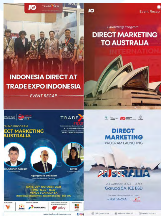
Gambar 2.3 Kumpulan Post Indonesia Direct di TEI 2023

Indonesia Direct telah berpartisipasi dalam Trade Expo Indonesia (TEI) beberapa kali di masa lalu, termasuk pada tahun 2023, di mana mereka meluncurkan program bernama Direct Marketing to Australia. Dalam program ini, Indonesia Direct bekerja sama dengan Atase Perdagangan Canberra dan Cendani Pty Ltd untuk meluncurkan program ini di Trade Expo Indonesia 2023 pada tanggal 20 Oktober. Untuk meningkatkan minat dan kesadaran tentang acara tersebut, tim media sosial membuat beberapa poster teaser dan informatif tentang acara peluncuran. Setelah acara peluncuran selesai, juga diunggah video rekap acara dan postingan promosi tentang program tersebut. Setiap postingan juga dilengkapi dengan ajakan bertindak (CTA) yang tepat untuk memastikan pengikut mereka berinteraksi dengan postingan tersebut. Semua promosi ini dilakukan untuk meningkatkan image Indonesia Direct sebagai perusahaan pengadaan ekspor global.