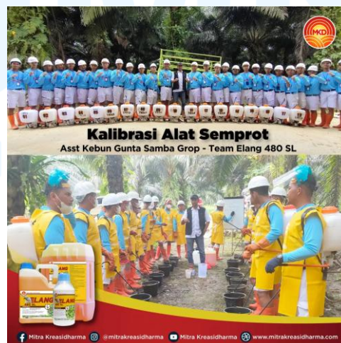
Gambar 2.6 Pelatihan Alat Semprot Kebun Gunta Samba Grup

PT Mitra Kreasidharma bersama Mengadakan pelatihan kalibrasi alat semprot di Kebun Gunta Samba Grup. Pelatihan itu diikuti oleh seluruh para asisten kebun untuk menguasai teknik kalibrasi dan aplikasi pestisida terutama menggunakan herbisida produk milik PT Mitra Kreasidharma. Adapun Produk yang digunakan dalam acara itu ialah ELANG® 480 SL berbahan aktif glifosat dengan tujuan agar para asisten memahami teknik dan dapat mengaplikasikan yang benar produk dengan benar untuk hasil yang optimal. (mitrakreasidharma.com,2025)