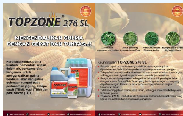
Gambar 2.4 feeds instagram TOPZONE 276 SL

Feeds berukuran 4:5 dengan resolusi 300 ppi ini bertujuan untuk memberi informasi mengenai produk herbisida yang bernama TOPZONE 276 SL. Feeds yang dipublikasikan berjumlah 2 gambar. Pada gambar pertama berisikan mengenai deskripsi singkat mengenai produk dan tanaman yang cocok untuk diberi herbisida TOPZONE 276 SL. Sedangkan pada gambar kedua berisikan mengenai gambar gulma yang dapat diatasi dan keunggulan dari produk. Agar memudahkan audiens untuk menggali informasi lebih lanjut dan menghubungi pihak perusahaan, diberikan media sosial yang dimiliki oleh PT Mitra Kreasidharma pada bagian bawah feeds.