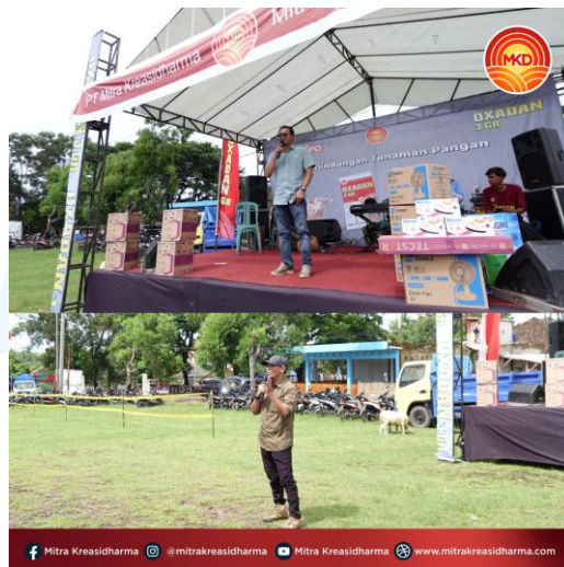
Gambar 2.3 Mitra Kreasidharma (MKD) Expo di Cidaun

Kegiatan Mitra Kreasidharma (MKD) Expo kali ini berlokasi di Jayanti, Desa Cidamar, Kecamatan Cidaun, sebagai bagian dari rangkaian peluncuran produk OXADAN 3 GR di wilayah sentra produksi bagian selatan Provinsi Jawa Barat. OXADAN 3 GR merupakan satu-satunya produk di Indonesia yang mengandung bahan aktif Oksamil, dengan mekanisme kerja sistemik pada tanaman. Kemampuan untuk mengendalikan hama yang menyerang bagian bawah maupun atas permukaan tanah yang terbukti efektif terhadap berbagai jenis serangga perusak akar dan vegetasi tanaman. Selain kegiatan peluncuran produk, acara ini juga diisi dengan hiburan bagi masyarakat sekitar, berbagai permainan interaktif, serta adanya hadiah berupa doorpize bagi peserta yang memiliki yang mengikuti kegiatan dengan syarat memiliki kupon pembelian produk (mitrakreasidharma.com,2024).