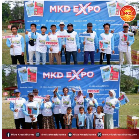
Gambar 2.5 Mitra Kreasidharma (MKD) Expo di Banyusidi