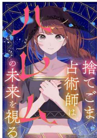
Gambar 2.6 Cover “Sutegoma Senjutsushi Harem no Mirai wo Miru” Sumber: company profile 2025 (2025)

Secara garis besar cerita, Webtoon ini menceritakan kisah seorang putri tunggal dari keluarga bangsawan Capella yang kehidupannya berubah drastis setelah terlibat dalam situasi darurat dimana pertunangannya dibatalkan dan dirinya dituduh sebagai pembunuh sang pangeran. Dalam upayanya mencari perlindungan, ia pergi ke kediaman ayah kandungnya, Duke Corvus yang dikenal sebagai “Reaper Duke”. Namun alih-alih mendapatkan perlindungan, ia justru harus dihadapkan dengan sikap dingin dan tak berperasaan dari sang ayah (Vertwo, 2025).