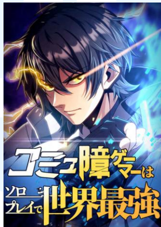
Gambar 2.8 Cover “Komyu-shou Bocchi ga Saikyou Pureiya ni!”

Cerita webtoon ini berfokus pada seorang bernama Licia, putri dari bangsawan tingkat rendah yang menjalani kehidupan yang sulit dalam penderitaan karena perlakuan buruk dari ibu tiri dan saudari tirinya. Namun suatu hari, kehidupannya berubah setelah tak diduga ia menerima lamaran dari Duke Lindverld, seorang bangsawan tinggi yang terkenal memiliki sifat dingin dan kaku, namun dihormati karena memiliki reputasi yang sempurna. Meskipun terlihat seperti kesempatan emas, sang duke sebenarnya mencari istri hanya secara kontrak untuk menghindari tekanan sosial (Vertwo, 2025).