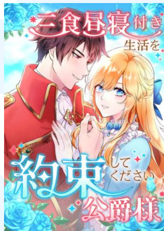
Gambar 2.7 Cover “Sanshoku-hirune-tsuki Seikatsu wo Yakusoku Shite Kudasai, Koushaku-sama!”

Kisah webtoon ini berfokus pada seorang gadis bernama Aliyah. Dia merupakan seorang yatim piatu yang memiliki kemampuan, dimana ia dapat melihat masa depan seseorang dengan cara bersentuhan dengan orang tersebut. Pada saat siang hari, ia merawat anak-anak di panti asuhan dimana tempat ia dibesarkan. Sementara pada malam hari ia harus bekerja menjadi seorang peramal untuk membantu kebutuhan perekonomian panti. Namun suatu hari, ketika ia menolong seorang bangsawan, tidak disangka kemudian ia mendapatkan tawaran untuk bergabung ke harem kerajaan (Vertwo, 2025).