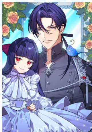
Gambar 2.5 Cover “Akuyaku Reijō wa Shinigami Papa ni Fukushū ga Shitainoni”

Vertwo telah mengerjakan berbagai proyek webtoon dengan beragam genre, terutama pada genre romance dan action , baik untuk pasar nasional maupun internasional. Vertwo telah menunjukkan kemampuan dan hasil dalam pembuatan visual dengan gaya ilustrasi yang beragam untuk kebutuhan pasar dan klien. Berikut ini merupakan bukti Vertwo telah berkontribusi dalam industri komik webtoon :