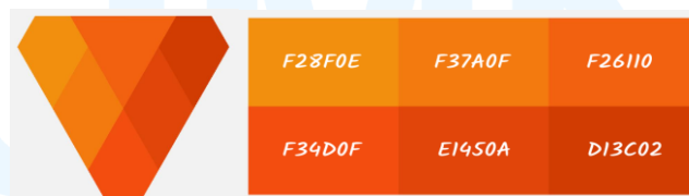
Gambar 2.2 Warna Logo Vertwo Sumber: Logo Concepts (2025)

Visi Vertwo adalah “ Empowering and elevating Indonesian artists to achieve lasting global recognition ” yang bisa diartikan, memajukan seniman Indonesia agar mendapatkan pengakuan pada tingkat internasional. Visi tersebut terbentuk dari misi perusahaan yang berisi: (1) menciptakan lingkungan kerja yang menyenangkan dan mendorong kultur dimana para seniman dapat mengembangkan keterampilan dan memperoleh penghidupan, (2) menjembatani industri kreatif Indonesia ke tingkat pasar internasional, dan (3) meningkatkan individu yang memiliki nilai kejujuran, antusiasme, tanggung jawab, kepercayaan, serta kompetensi dalam berkarya (Vertwo, 2025).