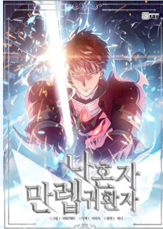
Gambar 2.9 Cover “Max Level Returner” Sumber: company profile 2025 (2025)

mematikan. Dengan pengetahuan luas tentang permainan ini, Kiyoshiro menjadi pemain terkuat yang menaklukkan berbagai tantangan. Namun, karena sifatnya yang tertutup dan canggung membuatnya kesulitan membentuk tim, menjadikannya petarung tunggal di dunia yang berbahaya ini (Vertwo, 2025).