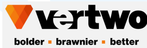
Gambar 2.1 Logo Vertwo

Vertwo merupakan perusahaan industri kreatif yang berfokus pada pembuatan webtoon . Berdiri sejak 20 Juni 2020, Vertwo terbentuk oleh para profesional yang memiliki pengalaman lebih dari satu dekade di industri kreatif. Perusahaan ini mendasar pada kepercayaan bahwa seniman di Indonesia memiliki kemampuan untuk bersaing secara global. Vertwo mendasarkan identitas perusahaannya pada moto “ Vertwo is our virtue ”. Kata virtue diartikan sebagai kualitas moral yang baik dalam diri tiap individu, serta penggambaran dari prinsip moralitas yang dihargai dalam menjalankan pekerjaan secara profesional. Vertwo telah menjadi media bagi lebih dari 150 para seniman dan telah memproduksi lebih dari 40 judul komik webtoon yang tersebar luas di berbagai platform secara internasional. (Vertwo, 2025)