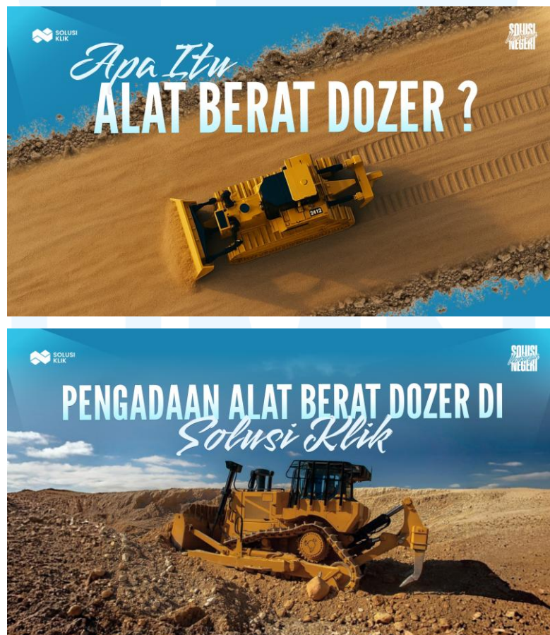
Gambar 2.4 Contoh SEO Banner Artikel

Solusi Klik juga secara rutin membuat artikel SEO yang bertujuan untuk meningkatkan peringkat di mesin pencari, memperbanyak jumlah klik, serta memperluas pengenalan brand di berbagai kalangan. Setiap artikel dilengkapi dengan banner atau gambar utama yang ditempatkan di bagian atas, tepat sebelum headline. Banner tersebut didesain khusus untuk menambah daya tarik visual, sehingga tampilan artikel tidak terlihat polos dan mampu menarik minat pembaca untuk terus men-scroll dan membaca isi artikel hingga selesai. Berikut contoh banner SEO pada Artikel Solusi Klik :