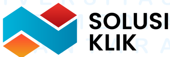
Gambar 2.1 Logo perusahaan Solusi Klik

Perusahaan ini memiliki visi menjadi penyedia barang dan jasa nomor satu yang berkontribusi dalam membangun Indonesia bebas korupsi. Misinya adalah bekerja dengan kepercayaan kepada Tuhan, memberikan hasil terbaik, mengembangkan ide kreatif, melayani pelanggan secara optimal, serta menerapkan kerja cerdas, cepat, tuntas, dan inovatif dengan sistem yang efisien.