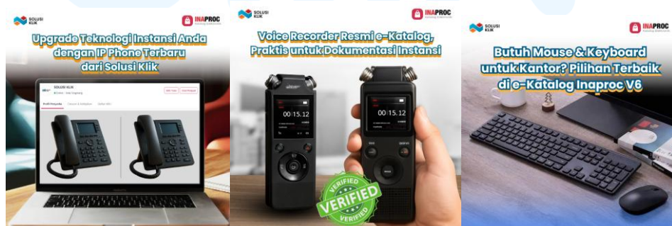
Gambar 2.3 Contoh Desain Gambar Woowa

Solusi Klik menggunakan Woowa, yaitu platform otomatisasi pesan berbasis WhatsApp API yang berfungsi sebagai media promosi dan distribusi pesan produk kepada klien. Melalui Woowa, Solusi Klik dapat mengirimkan broadcast produk secara efisien dan terarah. Dalam setiap desain Woowa, terdapat headline yang menarik untuk meningkatkan engagement serta copywriting persuasif yang mendorong klien mengunjungi tautan e-Katalog Inaproc Solusi Klik. Melalui tautan tersebut, klien dapat langsung melihat detail produk dan melakukan pembelian dengan mudah. Berikut merupakan beberapa contoh desain Woowa yang digunakan oleh Solusi Klik :