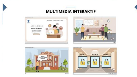
Gambar 2.3.2 Portofolio perusahaan multimedia interaktif

Gambar di atas merupakan kumpulan gambar screenshot yang menampilkan video podcast dari beberapa mata kuliah yang telah diunggah pada platform e-learning sebagai sarana pembelajaran daring bagi mahasiswa pada program studi terkait. Podcast tersebut menghadirkan para narasumber yang memiliki kompetensi dan pengetahuan sesuai dengan tema yang dibahas, sehingga diharapkan dapat mendukung pemahaman mahasiswa terhadap materi pembelajaran yang disampaikan.