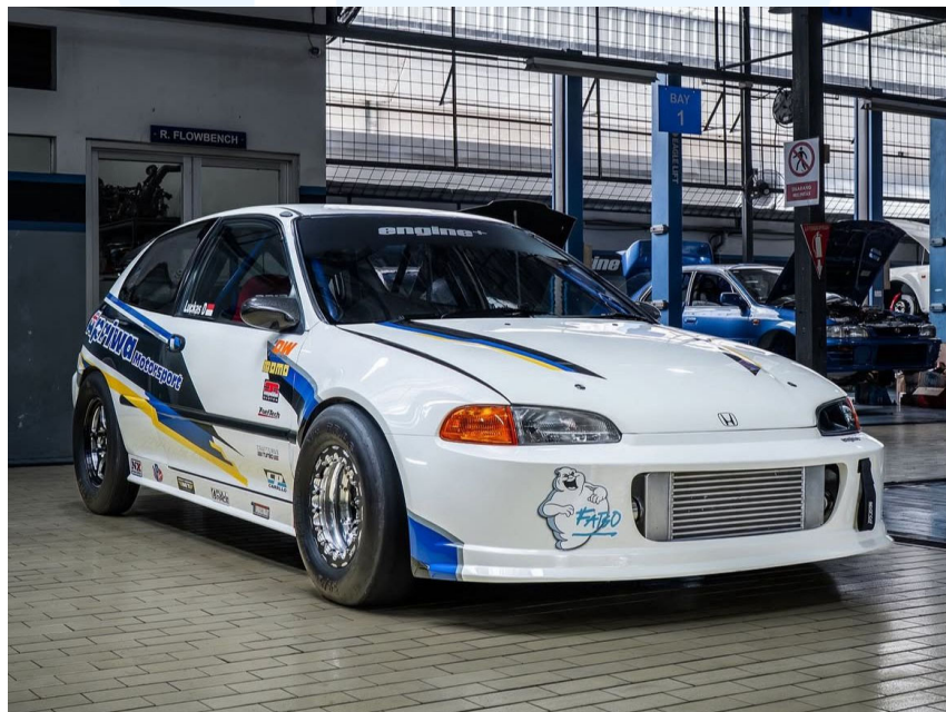
Gambar 2.6 Livery Desain “FATS”

Perusahaan juga mengikuti tandingan motorsport yang berlawanan dengan tim motorsport lain. Kadang ada satu tanjung balapan yang harus pakai mobil yang sama dengan lawan. Maka ada kebutuhan untuk sebuah perbedaan antara kendaraan kawan dan kendaraan lawan. Livery memiliki fungsi untuk identitas afiliasi kendaraan dengan tim saat perjalanan ajang balapan, Livery di desain dengan program kreatif vector oleh desainer dengan menggunakan warna perusahaan, elemen grafis atau supergraphic perusahaan, logo perusahaan yang bisa menjadi livery identitas khas tim motorsport antara tim yang lain.