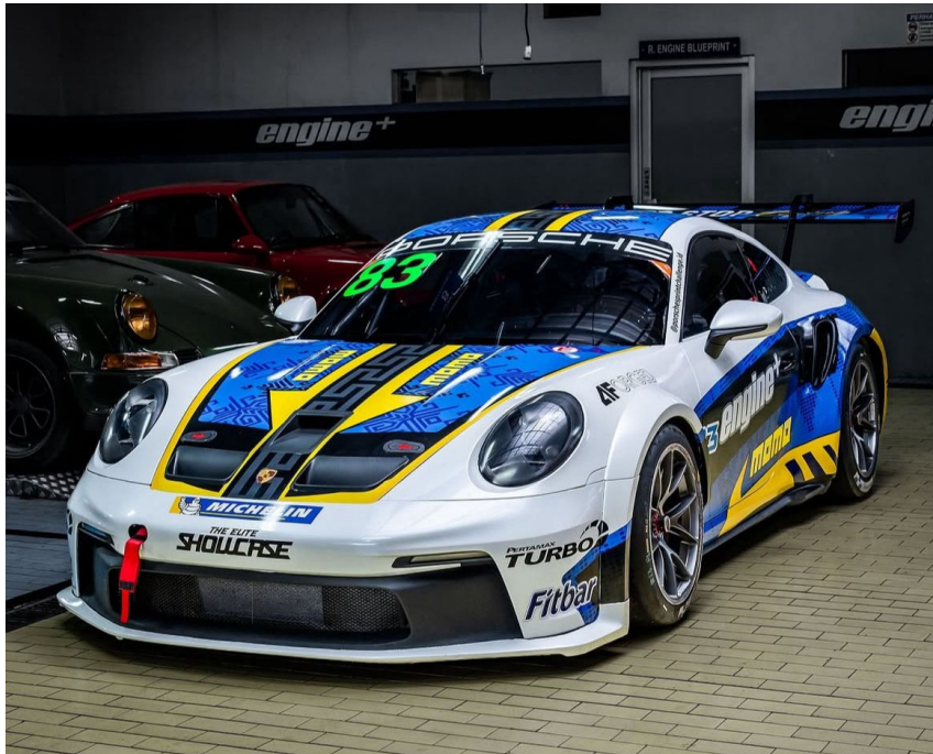
Gambar 2.7 Livery Desain Porsche GT3 Cup Car