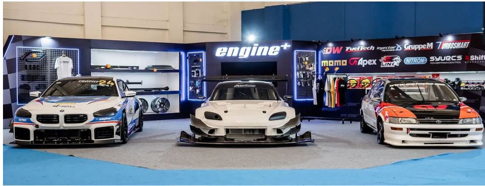
Gambar 2.4 Booth Engineplus IMX Tahun 2024

luar perusahaan. Setiap elemen konsep booth perusahaan memiliki LED Sign Logo Engineplus, Display produk-produk, Merchandise booth dan Display kendaraan perusahaan di booth.