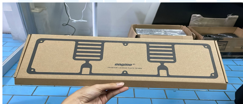
Gambar 2.5 Kemasan Depan License Plate Frame Engineplus

Engineplus membuat dan jual produk buatan sendiri seperti kosmetik Premium License Plate Frame untuk meningkat tampilan kendaraan. Pembeli yang minta beli pasti butuh kemasan. Kemasan produk ini memiliki fungsi untuk lindungi produk dari bentrokan fisik, melindungi dari cuaca dan membawa aksesories pelengkap produk. Secara teknis kemasan, menggunakan carton corrugated dengan sablon stensil sederhana.