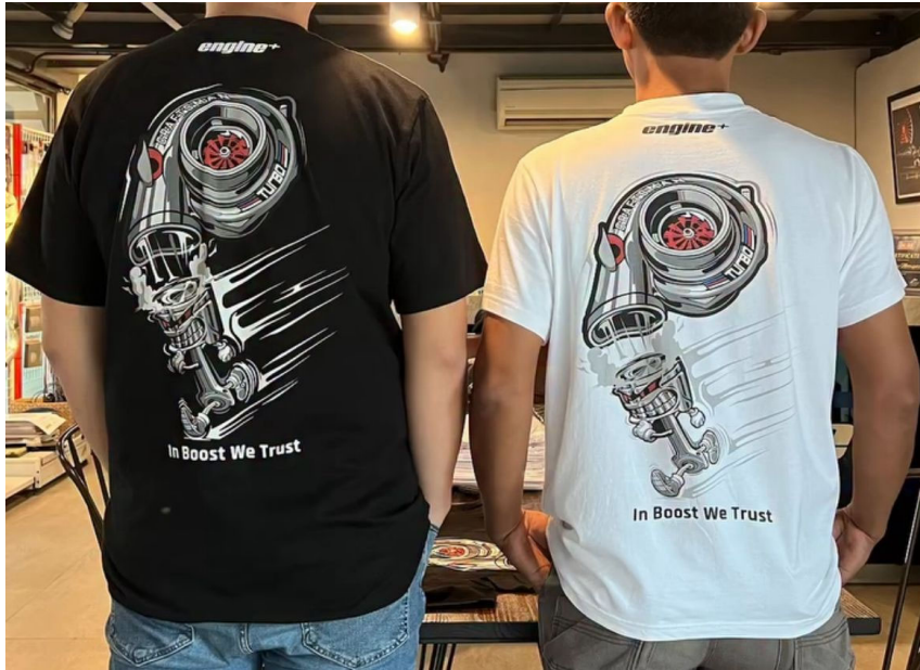
Gambar 2.8 Desain Kaos Engineplus - Craftman Turbo

Keseluruhan desain produk dan branding Engineplus banyak lebih ke desain grafis sebagai elemen utama, maupun kaos, livery atau kemasan produk. Di campur dengan tipografi sederhana sebagai pelengkap dan menyampaikan informasi atau pesan. Untuk spesifikasi produksi setiap karya di portofolio, seperti dus kemasan menggunakan sablon atau laser etching, kaos menggunakan karet, DTF, Discharge, Plastisol atau DTG yang tergantung pada bahan kaos. Untuk kendaraan Livery menggunakan bahan vinyl untuk ketahanan cuaca dan fleksibilitas. Untuk warna primer cenderung ke warna biru dongker, warna sekunder yang netral seperti hitam dan putih dan warna tertiary seperti kuning sebagai visual pop, bold yang menarik perhatian.