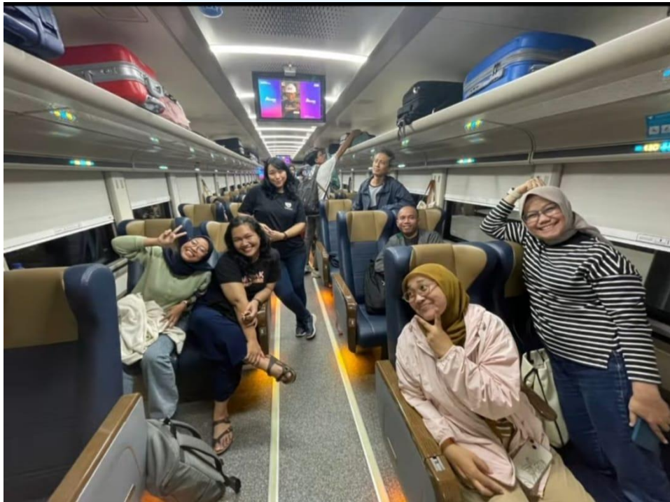
Gambar 2.5 Study visit ke UNIBRAW dan UNESA