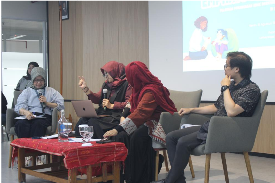
Gambar 2.4 Seminar Lingkungan Inklusif untuk Disabilitas

Acara tersebut menghadirkan berbagai narasumber yang datang dari berbagai kalangan. Berawal dari narasumber yang datang dari organisasi Art Therapy Media Center Bandung yang membawakan topik mengenai pelayanan terhadap mahasiswa-mahasiswi disabilitas dalam lingkungan di dalam kelas sampai dengan narasumber yang datang dari sesama dosen UMN yang membawakan topik mengenai bagaimana mengurus seorang mahasiswa yang mempunyai disabilitas mental khususnya dalam aspek autism , acara ini berlangsung selama 7 jam yang dipotong dengan waktu istirahat di jam makan siang, acara berakhir dengan sesi FGD yang fokus membahas mengenai pengalaman dalam mengurus mahasiswa-mahasiswi yang mempunyai disabilitas mental.