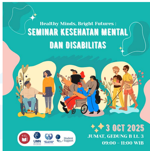
Gambar 2.3 Seminar Kesehatan Mental dan Disabilitas

Seminar ini dilaksanakan atas keikutsertaan berbagai mahasiswa relawan dibawah naungan UMN Buddies , sebuah komunitas mahasiswa UMN yang bersedia untuk menjadi tempat bercerita bagi mereka yang lebih nyaman untuk menceritakan permasalahan mental mereka kepada sesama mahasiswa dibandingkan dengan kounseling secara langsung.