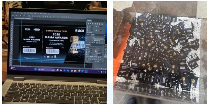
Gambar 2.3 Voucher MAMA Awards 2025

Pada tahap awal pengerjaan proyek ini, template voucher telah disediakan oleh klien sebagai acuan pengerjaan desain. Oleh karena itu, fokus utama dalam proses pengerjaan yang harus dilakukan adalah proses input barcode. Barcode yang diberikan oleh klien adalah identitas pada setiap voucher, sehingga proses pengerjaannya dilakukan secara teliti dan akurat.