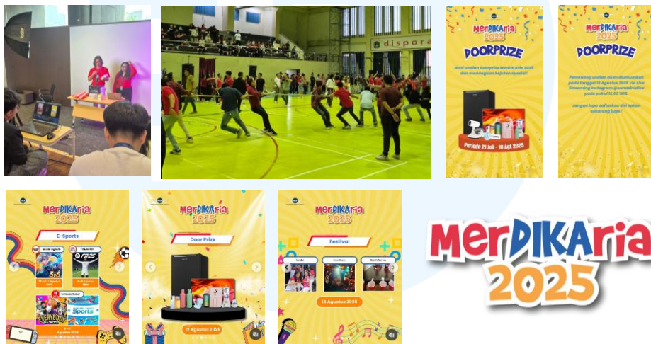
Gambar 2.4 Merdikaria 2025

Merdikaria merupakan acara peringatan 17 Agustus yang diselenggarakan oleh PT DIKA. Kegiatan ini berlangsung pada 14 Agustus 2025 pukul 14.00 WIB bertempat di GOR Benhil, Jakarta dan terbuka untuk seluruh karyawan PT DIKA. Acara Merdikaria menghadirkan beragam aktivitas, mulai dari live music, permainan interaktif, hingga pembagian doorprize.