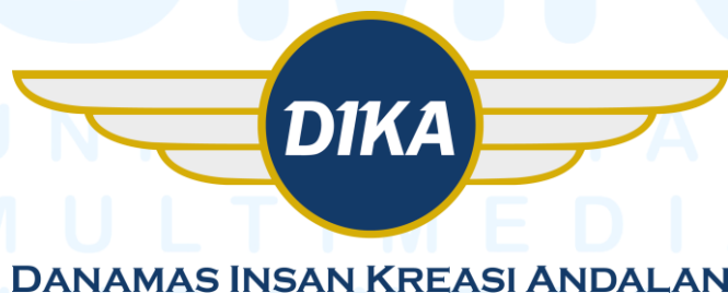
Gambar 2.1 Logo PT Danamas Insan Kreasi Andalan

PT Danamas Insan Kreasi Andalan (PT DIKA) merupakan perusahaan penyedia solusi outsourcing dan pengelolaan SDM terpercaya di Indonesia. Didukung oleh tim profesional berpengalaman dari industri keuangan dan jasa dan performa yang terbukti konsisten selama bertahun - tahun, PT DIKA berkomitmen menghadirkan solusi efisien dan efektif dalam upaya menjadi mitra bisnis andal bagi klien dalam pemenuhan kebutuhan tenaga kerja serta mendukung pengembangan bisnis di masa kini. Komitmen tersebut tercermin dari PT DIKA yang memiliki kondisi finansial kuat, tim manajemen yang berpengalaman, serta jaringan operasional yang tersebar di lebih dari 50 kota di seluruh Indonesia (Company Profile PT Danamas Insan Kreasi Andalan, 2024).