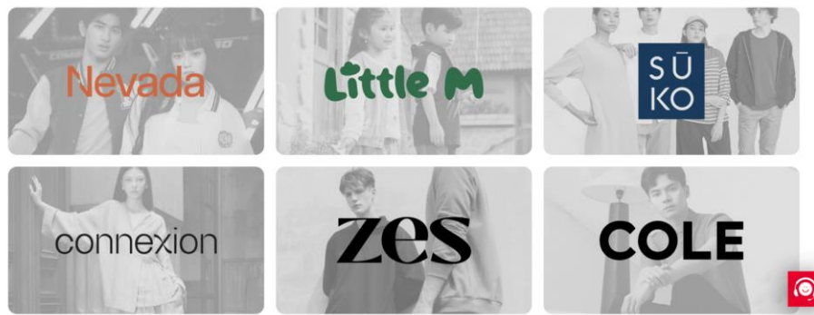
Gambar 2. 3 Label - Label Eksklusif PT Matahari Department Store Tbk

Sebagai sebuah perusahaan retail fast fashion terbesar di Indonesia, PT Matahari Department Store Tbk telah meluncurkan beberapa label eksklusif sebagai portofolio perusahaan. Label eksklusif PT Matahari Department Store Tbk tersebut antara lain adalah Nevada, Little M, SUKO, Connexion, ZES, dan Cole. Setiap