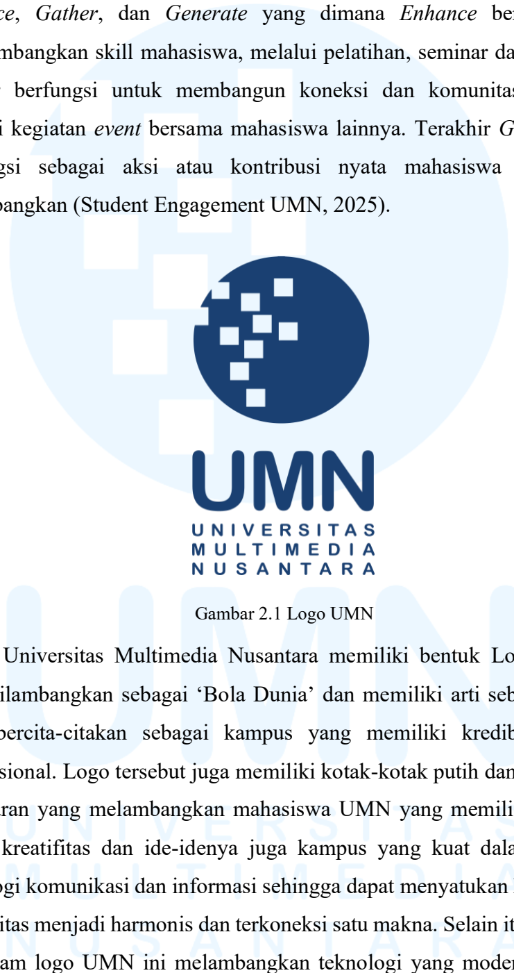
Gambar 2.1 Logo UMN

mahasiswa di sini adalah semua perkara mahasiswa selama belajar di UMN seperti keluhan selama belajar di UMN, pengajuan event , SKKM, development mahasiswa, dan lain-lain. Student Engagement memiliki tiga fungsi yaitu Enhance , Gather , dan Generate yang dimana Enhance bertugas untuk mengembangkan skill mahasiswa, melalui pelatihan, seminar dan kolaborasi. Gather berfungsi untuk membangun koneksi dan komunitas mahasiswa melalui kegiatan event bersama mahasiswa lainnya. Terakhir Generate yang berfungsi sebagai aksi atau kontribusi nyata mahasiswa yang sudah dikembangkan (Student Engagement UMN, 2025).