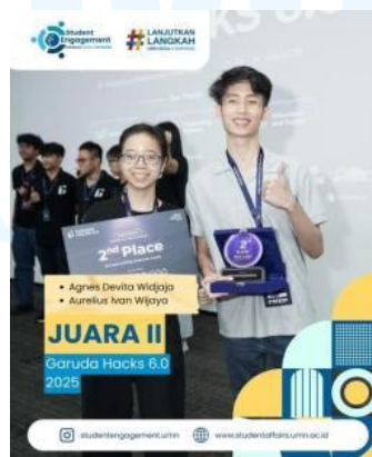
Gambar 2.3 Garuda Hacks 6.0