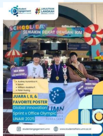
Gambar 2.4 Global Innovation Sprint

Global Innovation Sprint x Office Olympic UNAIR adalah sebuah ajang kompetisi untuk membantu generasi muda dalam pengembangan inovasi mereka dalam bidang bisnis dan membuat kolaborasi global. Pada kompetisi Global Innovation Sprint x Office Olympic UNAIR di tahun 2025, ajang ini membawakan sebuah tema “ Unlocking Potential: Empowering Teams for a Future of Innovation and Collaboration ” yang mana kompetisi ini mendorong peserta muda kompetisi untuk dapat memaksimalkan potensi diri mereka dan tim untuk menghadapi tantangan masa depan. Pada ajang ini, Global Innovation Sprint x Office Olympic UNAIR 2025 membuka dua tipe ajang kompetisi utama yaitu, Kompetisi Esai, dan Business Plan . Prestasi UMN di ajang ini, empat peserta mahasiswa dari UMN mengikuti perlombaan tipe