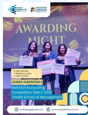
Gambar 2.6 National Accounting Competition