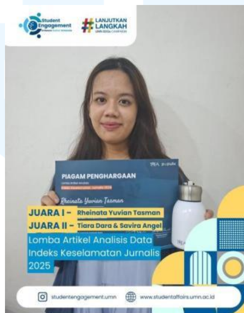
Gambar 2.7 Lomba Artikel Data Indeks Keselamatan Jurnalis 2025

Lomba Artikel Data Indeks Keselamatan Jurnalis adalah ajang kompetisi yang berfokus pada kompetisi yang mengembangkan keterampilan mahasiswa dan dosen dalam analisis data berbasis riset, juga untuk meningkatkan kesadaran dan pemahaman akan keselamatan jurnalis di Indonesia. Civitas Universitas Multimedia hadir dalam ajang kompetisi ini dan membawa pulang kejuaraan pertama dan kedua di tahun 2025 ( Student Engagement UMN, 2025 ).