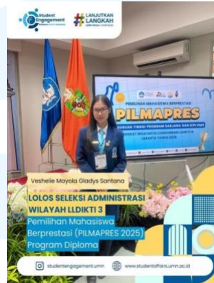
Gambar 2.5 PILMAPRES 2025

PILMAPRES atau Pemilihan Mahasiswa Berprestasi merupakan sebuah ajang untuk mahasiswa berprestasi yang di mana PILMAPRES ini bertujuan untuk mengembangkan inovasi anak bangsa melalui karya-karya mereka yang berhasil menjawab tantangan di masyarakat dan lingkungan sekitar. Mahasiswa Universitas Multimedia Nusantara lolos seleksi Administrasi wilayah LLDIKTI 3 dalam Pemilihan Mahasiswa Berprestasi 2025 program diploma ( Student Engagement UMN , 2025).