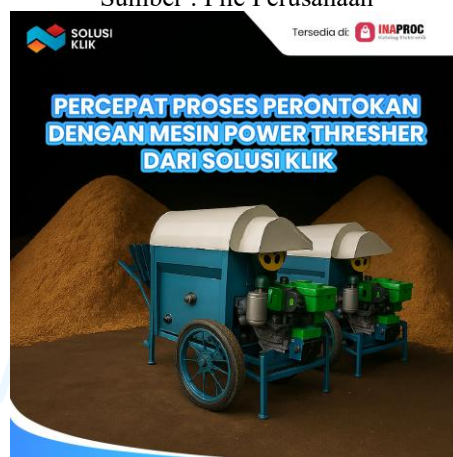
Gambar 2.7 BC WA alat Power Thresher