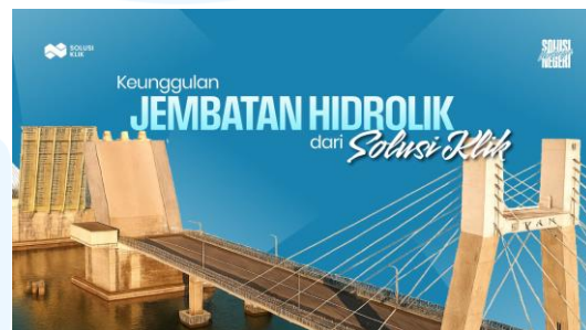
Gambar 2.5 artikel SEO jembatan Hidrolik