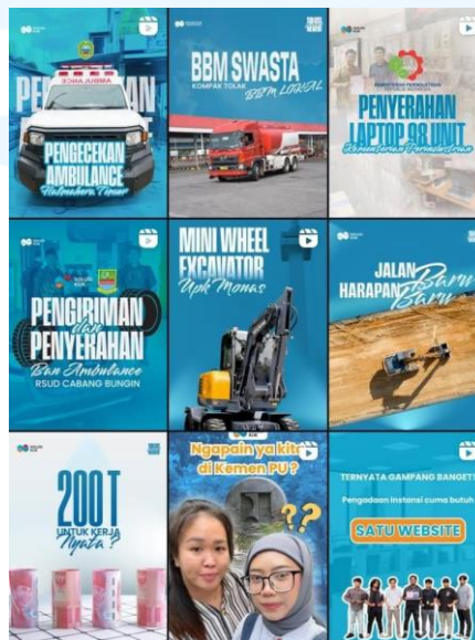
Gambar 2.11 Feeds Instagram Solusi Klik