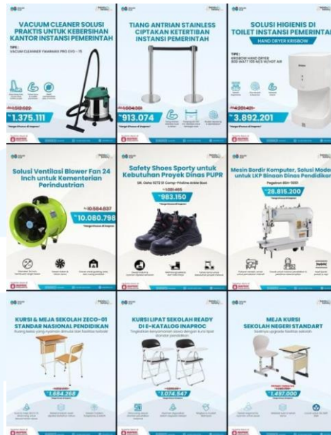
Gambar 2.10 Feeds Instagram Solusi Klik