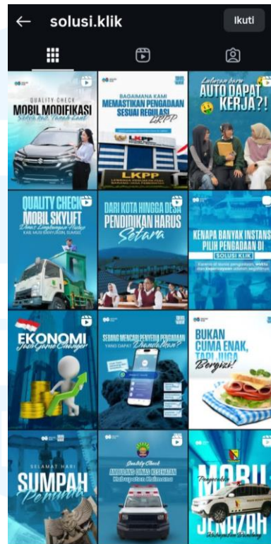
Gambar 2.3 Feeds instagram Solusi Klik

unboxing ), membahas isu – isu pemerintah yang sedang hangat dengan sedikit balutan promosi, peringatan hari nasional atau hari perayaan dan juga video dokumentasi serah terima barang kepada konsumen.