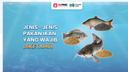
Gambar 2.4 artikel SEO pakan ikan

Dengan adanya poster – poster ini, audiens akan merasa lebih imersif saat membacanya dan mereka akan merasa lebih simpatik terhadap artikel tersebut. Selain itu poster juga berfungsi untuk memperkuat branding dari Solusi Klik dengan memperkenalkan gaya desain yang simpel namun khas, dan diharapkan dapat memberi rasa kepercayaan audiens terhadap Solusi Klik sebagai sumber informasi yang kredibel.