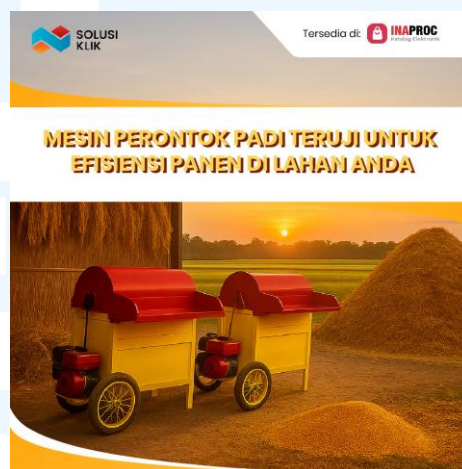
Gambar 2.6 BC WA alat Perontok Padi

Dikarenakan target audiens dari broadcast ini merupakan pejabat pemerintahan dengan usia sekitar 40 – 60 tahun, Gambar dibuat dengan desain yang simpel dan headline yang menonjol agar audiens dapat dengan mudah membacanya. Dengan desain yang dibuat diharapkan audiens akan tertarik dengan produk perusahaan dan berminat untuk melakukan transaksi.