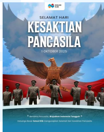
Gambar 2.8 desain peringatan Hari Kesaktian Pancasila

Pada hari – hari besar seperti hari peringatan Nasional ataupun hari besar agama ataupun hari perayaan, Solusi Klik selalu turut serta dalam mengucapkan dan ikut merayakan hari – hari besar, dengan membuat desain yang memperingati hari tersebut. Desain dibuat dengan colour pallete dari perusahaan, dan visual yang bold dan menarik menyesuaikan tema dan perasaan dari hari besar yang diperingati.