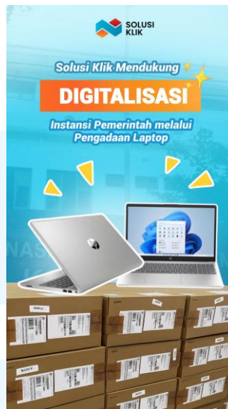
Gambar 2.9 Cover konten reels