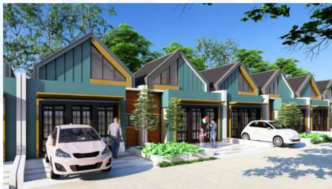
Gambar 2.17 Rumah Contoh pada Green Cibusah Residences tipe Komersial

Pada tahun ini yakni 2025 perusahaan BIG Group Indonesia meluncurkan proyek terbarunya yang dinamakan Green Cibusah Residences yang berlokasi di kabupaten Bekasi, Jawa Barat. Dalam pengembangan wilayah ini merupakan salah satu upaya strategis BIG Group untuk memperluas jangkauan pasarnya di wilayah penyangga ibu kota dengan menawarkan hunian berkualitas dengan harga terjangkau dengan adanya 2 tipe huniannya yakni tipe Exclusive Residential Commercial dan Subsidized Housing dari pemerintah dengan upaya menciptakan lingkungan hunian yang modern, nyaman, dan berkelanjutan dan ini merupakan bagian dari komitmen perusahaan untuk mendukung penyediaan perumahan yang layak bagi masyarakat Indonesia.