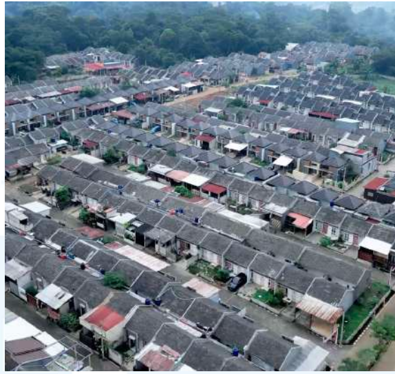
Gambar 2.5 Perumahan Citra Elok dari sisi atas

Pada tahun 2023, BIG Group Indonesia memperluas kiprahnya melalui akuisisi Villa Bukit Tirtayasa di Bandar Lampung yang kemudian direbranding menjadi Casa Laverde Lampung. Proyek tersebut mendapat respons positif dari pasar dengan pencapaian penjualan Mencapai 150 unit hunian dalam waktu yang relatif singkat (BIG Group Indonesia, 2024).