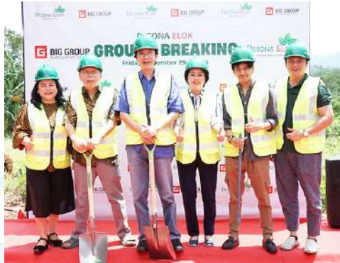
Gambar 2.16 Dokumentasi dalam prospektif pada proyek Pesona Elok

Pada tahun ini yakni 2025 perusahaan BIG Group Indonesia meluncurkan proyek terbarunya yang dinamakan Green Cibusah Residences yang berlokasi di kabupaten Bekasi, Jawa Barat. Dalam pengembangan wilayah ini merupakan salah satu upaya strategis BIG Group untuk memperluas jangkauan pasarnya di wilayah penyangga ibu kota dengan menawarkan hunian berkualitas dengan harga terjangkau dengan adanya 2 tipe huniannya yakni tipe Exclusive Residential Commercial dan Subsidized Housing dari pemerintah dengan upaya menciptakan lingkungan hunian yang modern, nyaman, dan berkelanjutan dan ini merupakan bagian dari komitmen perusahaan untuk mendukung penyediaan perumahan yang layak bagi masyarakat Indonesia.