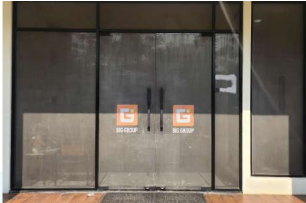
Gambar 2.2 Pintu Kantor BIG Group Indonesia