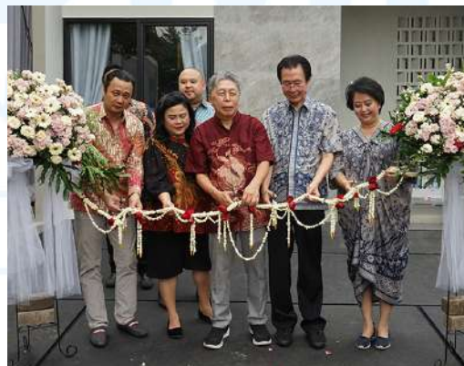
Gambar 2.20 Dokumentasi pada event Rilis di Villa Rosa