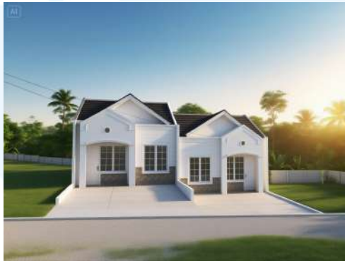
Gambar 2.12 Rumah Contoh pada Citra Elok

Perusahaan BIG Group Indonesia merupakan sebuah perusahaan yang berkembang dalam bidang properti, dan perusahaan tersebut telah berkembang pesat di Indonesia sejak tahun 2020. Berawal dari proyek perdananya, Citra Elok Jonggol, BIG Group Indonesia mengembangkan kawasan residensial komersial di atas lahan seluas 7 hektar dan berhasil menjual lebih dari 600 unit rumah dalam kurun waktu dua tahun. Keberhasilan tersebut menjadi pijakan bagi perusahaan untuk memperluas bisnis ke berbagai daerah di Indonesia (BIG Group Indonesia, 2024).