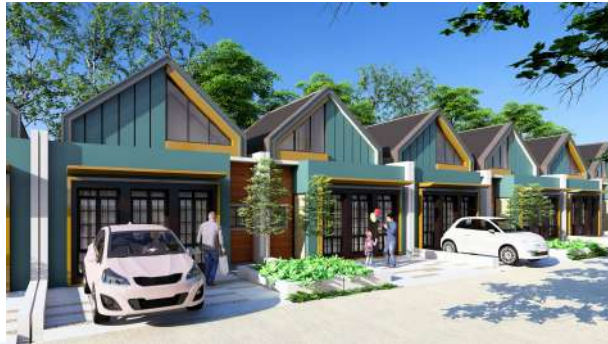
Gambar 2.9 Green Cibirusah Residences tipe Komersial