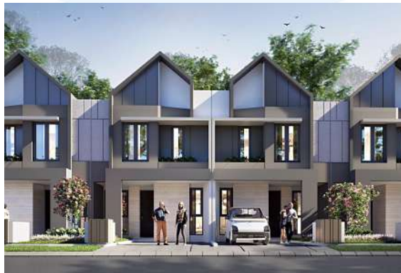
Gambar 2.14 Rumah Contoh Pada Pesona Elok

Pada tahun 2024, BIG Group Indonesia meluncurkan dua proyek strategis yakni, Pesona Elok yang berada di bogor dan Villa Rosa Karawaci yang berada di tangerang. pada proyek Pesona Elok dikembangkan pada lahan seluas 6 hektar untuk menyediakan hunian berkualitas dengan harga terjangkau, sedangkan dalam proyek Villa Rosa Karawaci dirancang sebagai hunian bernuansa resor di area seluas 5.000 m 2 dan mencakup 34 unit rumah dua lantai, dengan harga mulai Rp 900 jutaan per unitnya.