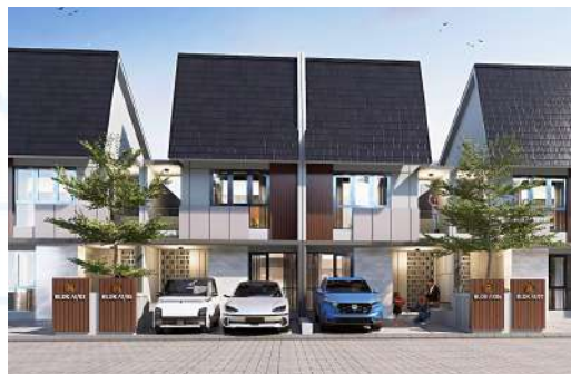
Gambar 2.15 Rumah Contoh pada Villa Rosa Karawaci