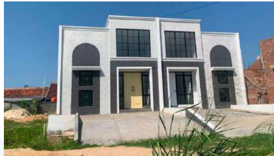
Gambar 2.6 Perumahan Casa Laverde @Villa Bukit Tirtayasa

Pada tahun 2023, BIG Group Indonesia memperluas kiprahnya melalui akuisisi Villa Bukit Tirtayasa di Bandar Lampung yang kemudian direbranding menjadi Casa Laverde Lampung. Proyek tersebut mendapat respons positif dari pasar dengan pencapaian penjualan Mencapai 150 unit hunian dalam waktu yang relatif singkat (BIG Group Indonesia, 2024).