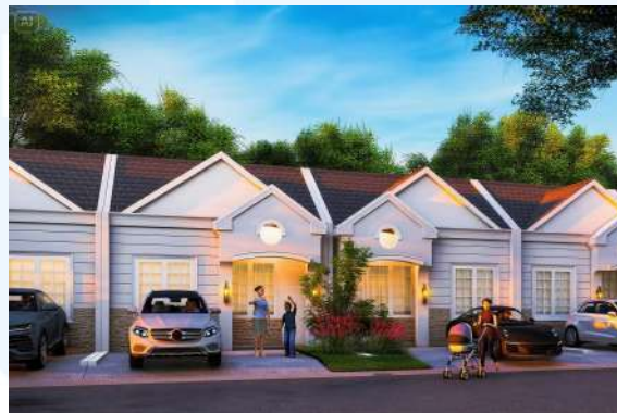
Gambar 2.10 Perumahan Green Cibirusah Residences tipe Subsidi

Secara keseluruhan, perjalanan BIG Group Indonesia menunjukkan konsistensi dalam mengembangkan proyek-proyek properti yang berorientasi pada pertumbuhan jangka panjang. Komitmen perusahaan tidak hanya terletak pada perluasan pasar, tetapi juga pada penyediaan pelayanan optimal guna meningkatkan kepuasan konsumen serta menjaga daya saing di tengah perkembangan industri properti nasional (BIG Group Indonesia, 2024).