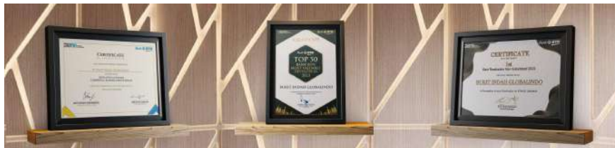
Gambar 2.19 Penghargaan yang didapatkan pada proyek Villa Rosa

Selain pengembangan proyek, BIG Group Indonesia juga aktif dalam publikasi berita dan pencapaian perusahaan tersebut. yakni, pada proyek Villa Rosa Karawaci yang dirilis melalui media pers untuk menarik minat konsumen serta membangun brandingan perusahaan (BIG Group Indonesia, 2024). Keberhasilan tersebut turut diperkuat dengan capaian prestasi seperti penghargaan “ Best Realization Non-Subsidized 2022 ” dan penghargaan dari Bank BTN atas pencapaian penyaluran KPR senilai Rp 100 miliar lebih (BIG Group Indonesia, 2024).