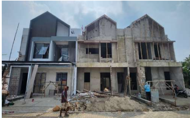
Gambar 2.7 Pembangunan Perumahan Pesona Elok