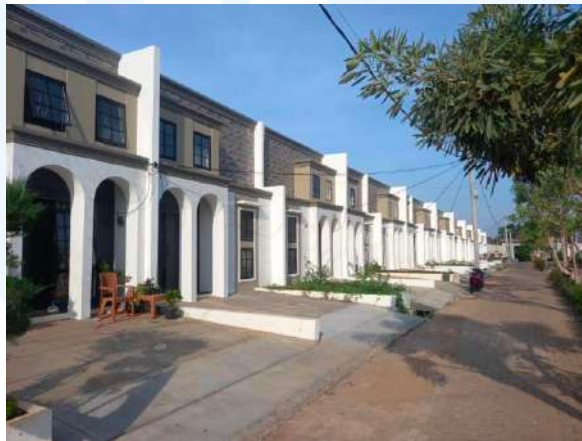
Gambar 2.3 Perumahan Citra Elok