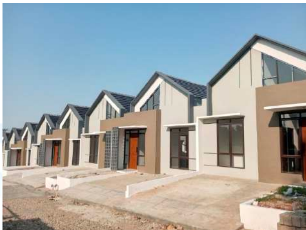
Gambar 2.4 Perumahan Citra Elok Type Acacia