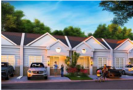
Gambar 2.18 Rumah Contoh Pada Green Cibirusah Residences tipe Subsidi

Selain pengembangan proyek, BIG Group Indonesia juga aktif dalam publikasi berita dan pencapaian perusahaan tersebut. yakni, pada proyek Villa Rosa Karawaci yang dirilis melalui media pers untuk menarik minat konsumen serta membangun brandingan perusahaan (BIG Group Indonesia, 2024). Keberhasilan tersebut turut diperkuat dengan capaian prestasi seperti penghargaan “ Best Realization Non-Subsidized 2022 ” dan penghargaan dari Bank BTN atas pencapaian penyaluran KPR senilai Rp 100 miliar lebih (BIG Group Indonesia, 2024).