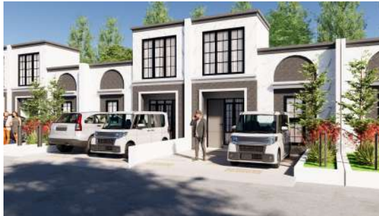
Gambar 2.13 Rumah Contoh Pada Casa Lavende @Villa Bukit Tirtayasa

Pada tahun 2024, BIG Group Indonesia meluncurkan dua proyek strategis yakni, Pesona Elok yang berada di bogor dan Villa Rosa Karawaci yang berada di tangerang. pada proyek Pesona Elok dikembangkan pada lahan seluas 6 hektar untuk menyediakan hunian berkualitas dengan harga terjangkau, sedangkan dalam proyek Villa Rosa Karawaci dirancang sebagai hunian bernuansa resor di area seluas 5.000 m 2 dan mencakup 34 unit rumah dua lantai, dengan harga mulai Rp 900 jutaan per unitnya.