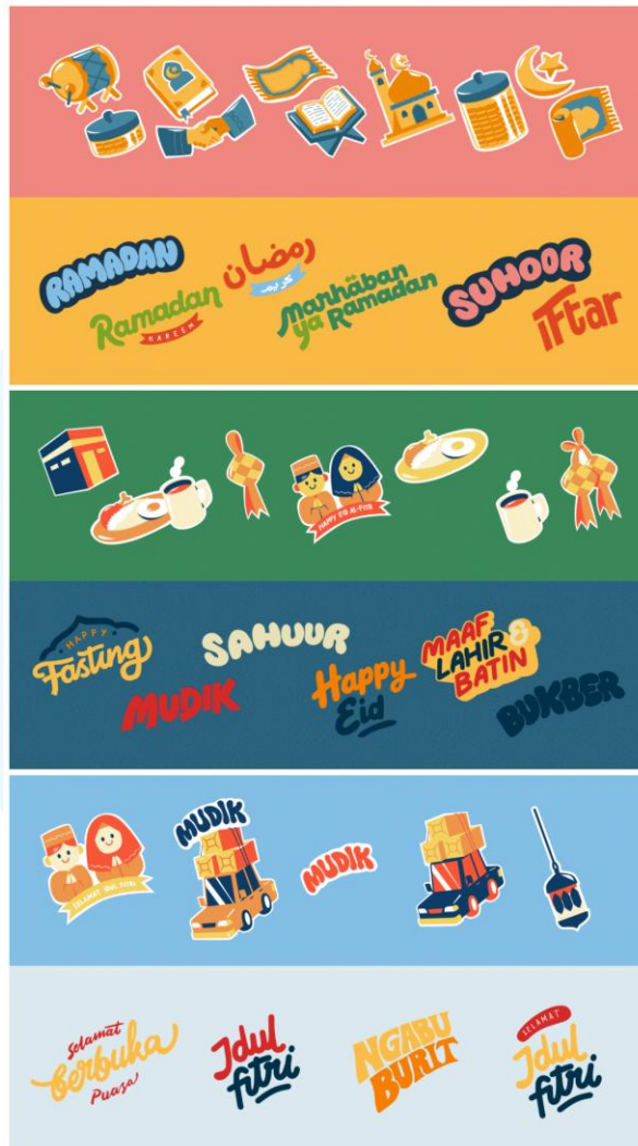
Gambar 2.6 Kumpulan Aset Ilustrasi Eid Mubarak

Kamaji Studio juga telah memperjualbelikan berbagai produk digital yang mereka hasilkan di situs microstock seperti Envato dan Canva Elements. Di situs Envato, Kamaji Studio menggunakan nama Majika Box dan menjual template grafis serta aset ilustrasi. Sedangkan di situs Canva Elements, Kamaji Studio lebih fokus menjual aset ilustrasi.