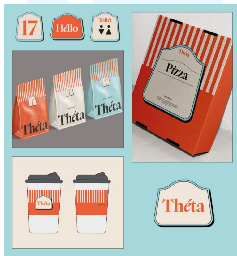
Gambar 2.5 Desain Identitas Visual Brand Théta

Selain ilustrasi, desain yang pernah dihasilkan oleh Kamaji Studio adalah identitas visual untuk brand Théta. Dalam pembuatan identitas Cafe Théta, nilai yang diangkat adalah peran Cafe Théta yang tak hanya menjadi tempat makan dan berkumpul, tetapi juga sebagai tempat dimana oleh-oleh khas Malang seperti jajanan tradisional bisa dibawa pulang oleh pengunjung, khususnya pengunjung dari luar Kota Malang. Output media yang dibuat oleh Kamaji Studio mencakup logo, desain packaging , dan signage .