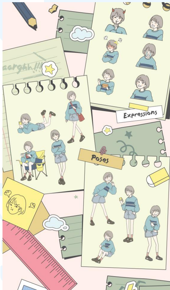
Gambar 2.4 Sheet Karakter Ria SW dalam Projek Hello My Silly Friend Sumber: Behance Kamaji Studio

Dalam kurun 4 tahun, Kamaji Studio telah menghasilkan bermacam-macam karya desain. Salah satu proyek ilustrasi yang pernah dikerjakan oleh Kamaji Studio adalah ilustrasi Hello My Silly Friend untuk web series seorang food vlogger Indonesia, Ria SW. Web series ini menceritakan perjalanan dari Ria SW dan Aquin yang menghabiskan waktu bersama selama tujuh hari meskipun keduanya tidak memiliki hubungan yang terlalu dekat. Output yang dihasilkan untuk proyek ini mencakup desain karakter Ria SW dan Aquin, aset visual berupa border , icon , dan pattern , font , serta animasi untuk bagian pembuka video.