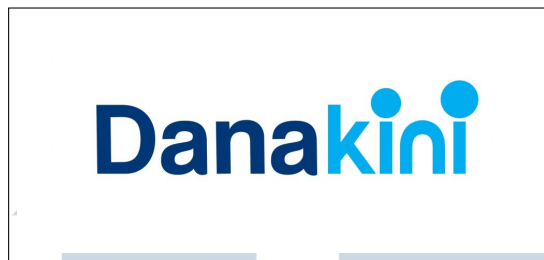
Gambar 2.2. Logo PT Dana Kini Indonesia