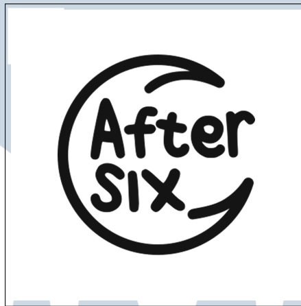
Gambar 2.1. Logo perusahaan PT Visi Karya Nusantara

PT Visi Karya Nusantara, yang lebih dikenal dengan AfterSix, didirikan pada tahun 2025 dan bergerak di bidang software house . Perusahaan ini berlokasi di Start Space Coworking Space Gading Serpong. Saat ini, perusahaan tengah mengerjakan berbagai proyek di antaranya Nine to Six, AKS, IkoVisual, Beeliv, dan KAIYA. Salah satu identitas perusahaan dapat dilihat pada Gambar 2.1, yang menampilkan logo resmi PT Visi Karya Nusantara.