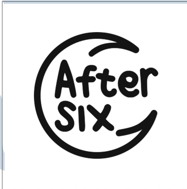
Gambar 2.1. Logo Perusahaan PT Visi Karya Nusantara

PT Visi Karya Nusantara adalah perusahaan yang menjalankan kegiatan usaha di sektor teknologi informasi, khususnya sebagai Software House yang berlokasi di Start Space Coworking Space Gading Serpong. Perusahaan ini resmi berdiri sebagai badan hukum PT (Perseroan Terbatas) pada tahun 2025. Hingga saat ini, PT Visi Karya Nusantara memiliki 10 karyawan dari berbagai divisi. Selain itu, perusahaan telah menyelesaikan berbagai project , seperti Program Order Marketing & Order Produksi AKS, Program Sistem HRD, Company Profile & CMS (Beeliv), Company Profile & CMS (IkoVisual), Program Proses Produksi AKS.