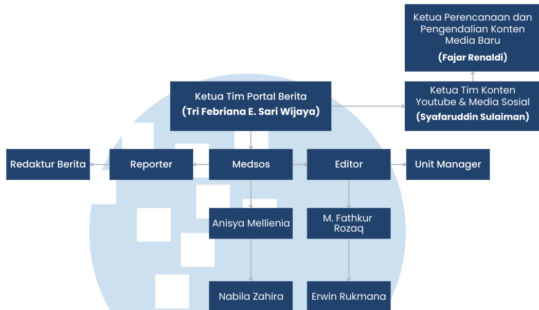
Gambar 2. 2 Struktur Organisasi TVRI