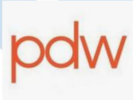
Gambar 1. 1 Logo PT. Pandega Desain Weharima