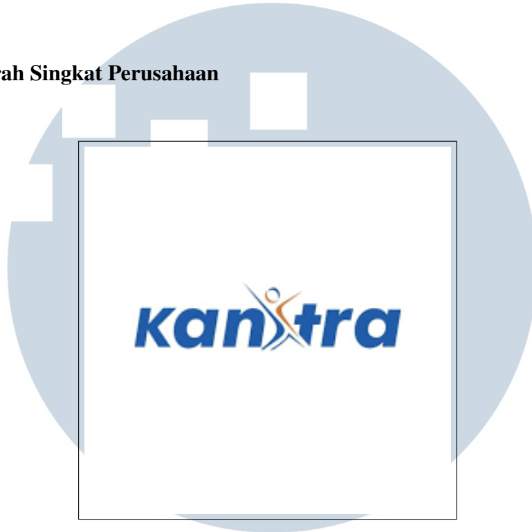
Gambar 2.1. Logo Kanitra

Koperasi Karyawan PT United Tractors Tbk merupakan unit koperasi yang dikhususkan bagi para karyawan-karyawan PT United Tractors. Koperasi ini tidak hanya melayani simpan pinjam, namun juga menyediakan banyak layanan lainnya seperti food court , toko, cicilan kendaraan bermotor, penyewaan mobil, bengkel dan pengurusan STNK kendaraan, investasi, dan masih banyak yang lain. Meskipun Kanitra berpusat di Cakung, namun Kanitra tetap memiliki unit koperasi lain di setiap cabang United Tractors yang tersebar di seluruh Indonesia.