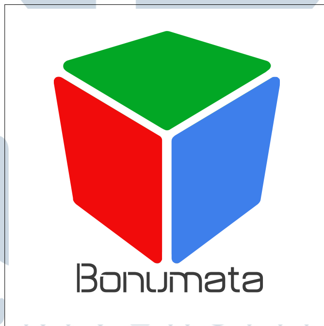
Gambar 2.1. Logo PT Bonum Mata Asia

PT Bonum Mata Asia merupakan sebuah perusahaan penyedia solusi Teknologi Informasi yang berfokus pada pengembangan sistem dan aplikasi untuk menjawab berbagai kebutuhan bisnis. Perusahaan ini beroperasi dengan visi untuk ”memberikan solusi tepat guna dan lebih dari yang diharapkan”. Guna mewujudkan visi tersebut, PT Bonum Mata Asia didukung oleh para ahli di bidangnya, dengan keahlian yang mencakup perencanaan infrastruktur , pengembangan sistem aplikasi (baik berbasis web maupun mobile) , implementasi sistem , hingga layanan pemeliharaan (maintenance services) dan solusi Datawarehouse Business Intelligence. Logo perusahaan dapat dilihat pada Gambar 2.1.