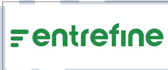
Gambar 2.1. Logo PT Entrefine Data Indonesia [6]

efisien, dan relevan dengan kebutuhan pelaku usaha yang memiliki keterbatasan waktu maupun pengetahuan teknis. Layanan yang dikembangkan bertujuan untuk menyederhanakan proses interpretasi data sehingga dapat memberikan dampak langsung terhadap peningkatan kinerja bisnis [6]. Logo PT Entrefine Data Indonesia ditampilkan pada Gambar 2.1 sebagai identitas visual perusahaan.