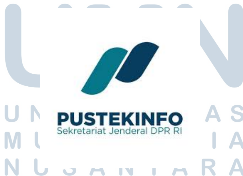
Gambar 2.1. Logo PUSTEKINFO Setjen DPR RI

Sebelum bertransformasi menjadi PUSTEKINFO, unit ini dikenal sebagai Bidang Data dan Teknologi Informasi (BDTI) yang berada di bawah Pusat Data dan Informasi (PUSDATIN). Seiring dengan kebutuhan organisasi yang semakin berkembang, berdasarkan Peraturan Sekretaris Jenderal DPR RI Nomor 6 Tahun 2021 tentang Organisasi dan Tata Kerja Setjen DPR RI, BDTI ditingkatkan statusnya menjadi Pusat Teknologi Informasi (PUSTEKINFO). Perubahan ini bertujuan untuk memperkuat fungsi pengembangan sistem informasi, pengelolaan infrastruktur jaringan, serta peningkatan aspek keamanan teknologi informasi di lingkungan DPR RI [9].