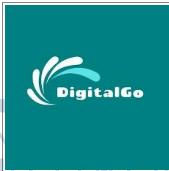
Gambar 2.1. Logo PT. Surya Digital Indonesia

PT. Surya Digital Indonesia (DigitalGo) merupakan perusahaan agensi digital yang berdiri pada tahun 2020 dan bergerak di bidang teknologi informasi serta layanan digital terpadu. Sejak awal berdirinya, DigitalGo berfokus pada penyediaan solusi kreatif dan inovatif untuk membantu bisnis beradaptasi di era digital. Perusahaan ini memulai aktivitasnya melalui layanan pengembangan situs web, strategi pemasaran digital, dan manajemen media sosial [7]. Seiring perkembangan waktu, DigitalGo memperluas bidang usahanya ke layanan periklanan daring, serta pengembangan aplikasi mobile dan game interaktif. Dengan dukungan tim profesional yang adaptif terhadap perkembangan teknologi, DigitalGo berhasil membangun reputasi sebagai mitra digital terpercaya. Saat ini, perusahaan terus berinovasi dengan menjunjung nilai kreativitas, efisiensi, dan hasil nyata, serta berfokus pada pengembangan layanan berbasis data untuk mendukung transformasi digital di Indonesia.