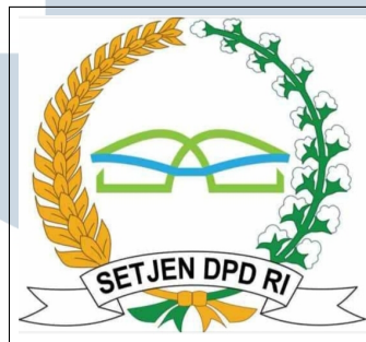
Gambar 2.1. Logo Sekretariat Jenderal DPR RI

Sekretariat Jenderal Dewan Perwakilan Rakyat Republik Indonesia (Setjen DPR RI) ditampilkan pada Gambar 2.1 merupakan unsur penunjang DPR yang berkedudukan sebagai kesekretariatan lembaga. Berdasarkan Peraturan Presiden Republik Indonesia Nomor 26 Tahun 2020, Setjen DPR RI adalah aparatur pemerintah yang dalam menjalankan tugas dan fungsinya berada di bawah serta bertanggung jawab langsung kepada Pimpinan DPR RI. Setjen dipimpin oleh seorang Sekretaris Jenderal.