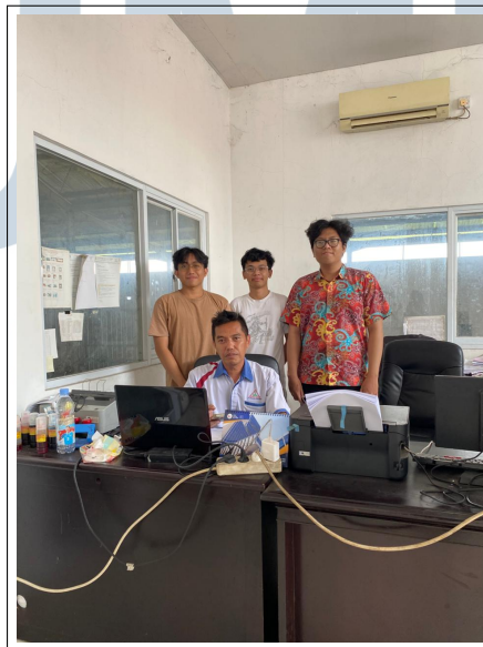
Gambar 2.2. Foto dengan direktur perusahaan

Gambar 2.2 merupakan foto tim developer dengan Direktur perusahaan. selain itu lokasi perusahaan dapat diakses melalui Google Maps pada tautan berikut: https://share.google/IWJyAyUpCdHFILCdj