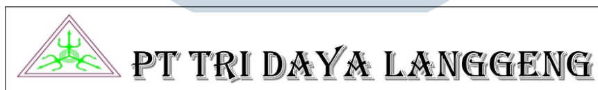
Gambar 2.1. Logo Perusahaan PT Tri Daya Langgeng (Dokumentasi Internal)

PT Tri Daya Langgeng didirikan pada tahun 2016 sebagai perusahaan yang bergerak di bidang industri manufaktur. Pada masa awal berdirinya, perusahaan masih dalam tahap perintisan dengan lokasi usaha yang beroperasi di daerah Sangiang Jaya, Kecamatan Periuk, Kota Tangerang. Pada periode tersebut, jumlah karyawan yang dimiliki masih terbatas, hanya sekitar 10 orang, termasuk tenaga administrasi dan pekerja lapangan di bagian produksi. Jumlah klien yang bekerja sama juga masih relatif sedikit, yaitu sekitar 3 hingga 6 perusahaan setiap bulannya, bahkan belum selalu konsisten karena sifat pemesanan yang masih bergantung pada kebutuhan tertentu. Kondisi ini menunjukkan bahwa pada fase awal, PT Tri Daya Langgeng masih dalam tahap membangun kepercayaan dan memperkenalkan diri di tengah persaingan industri.